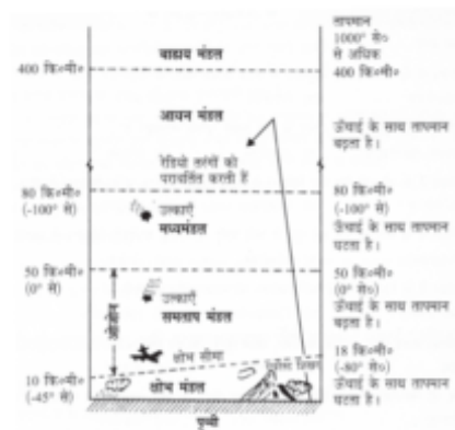
वायुमंडल की संरचना

(2) समतापमंडल (Stratosphere) :- यह परत 50 किलोमीटर तक विस्तृत है। इसके निचले भाग में 20 किलोमीटर की ऊँचाई तक तापमान में कोई परिवर्तन नहीं आता इसलिए इसे समतापमण्डल कहते हैं। इसके ऊपर 50 किलोमीटर की ऊँचाई तक तापमान में वृद्धि होती है इस परत के निचले भाग में ओजोन गैस उपस्थित है जो सूर्य से आने वाली पराबैंगनी विकिरण का अवशोषण करती है।