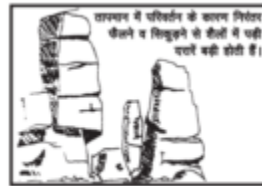
(2) संकुचन एवं विस्तारण

(2) संकुचन एवं विस्तारण (Shrink and Expansion) :- शैलों में मौजूद खनिज तापमान बढ़ने से फैलते हैं एवं तापमान कम होने से सिकुड़ते हैं इस प्रक्रिया से शैलें कमजोर होकर टूटती हैं।