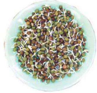
चित्र-1.1 अंकुरित बीज

अंकुरित बीजों को सावधानी से धोकर आप इन्हें खा सकते हैं। ये उबाले भी जा सकते हैं। इनमें कुछ मसाले मिलाने पर खाने के लिए एक स्वादिष्ट अल्पाहार तैयार हो जाता है।