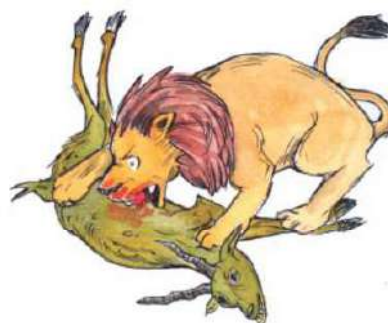
चित्र- 1.3 शाकाहारी, माँसाहारी जन्तु भोजन करते हुए