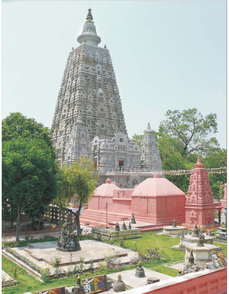
चित्र 9.1 महाबोधि मंदिर (बोधगया)

बोधिवृक्ष के नीचे बैठकर कई बौद्ध भिक्षु भगवान बुद्ध