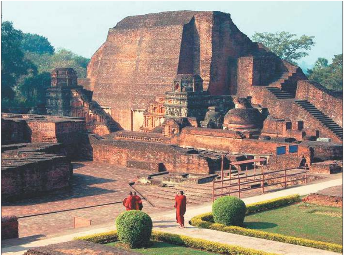
चित्र 9.4 नालंदा विश्वविद्यालय (नालंदा)

अवशेष रूप में हैं। यह विश्वविद्यालय ज्ञान-विज्ञान के अन्तर्राष्ट्रीय केन्द्र के रूप में विख्यात था। यहाँ नामांकन के लिए प्रवेश परीक्षा होती थी। देश-विदेश से लगभग 10 हजार छात्र