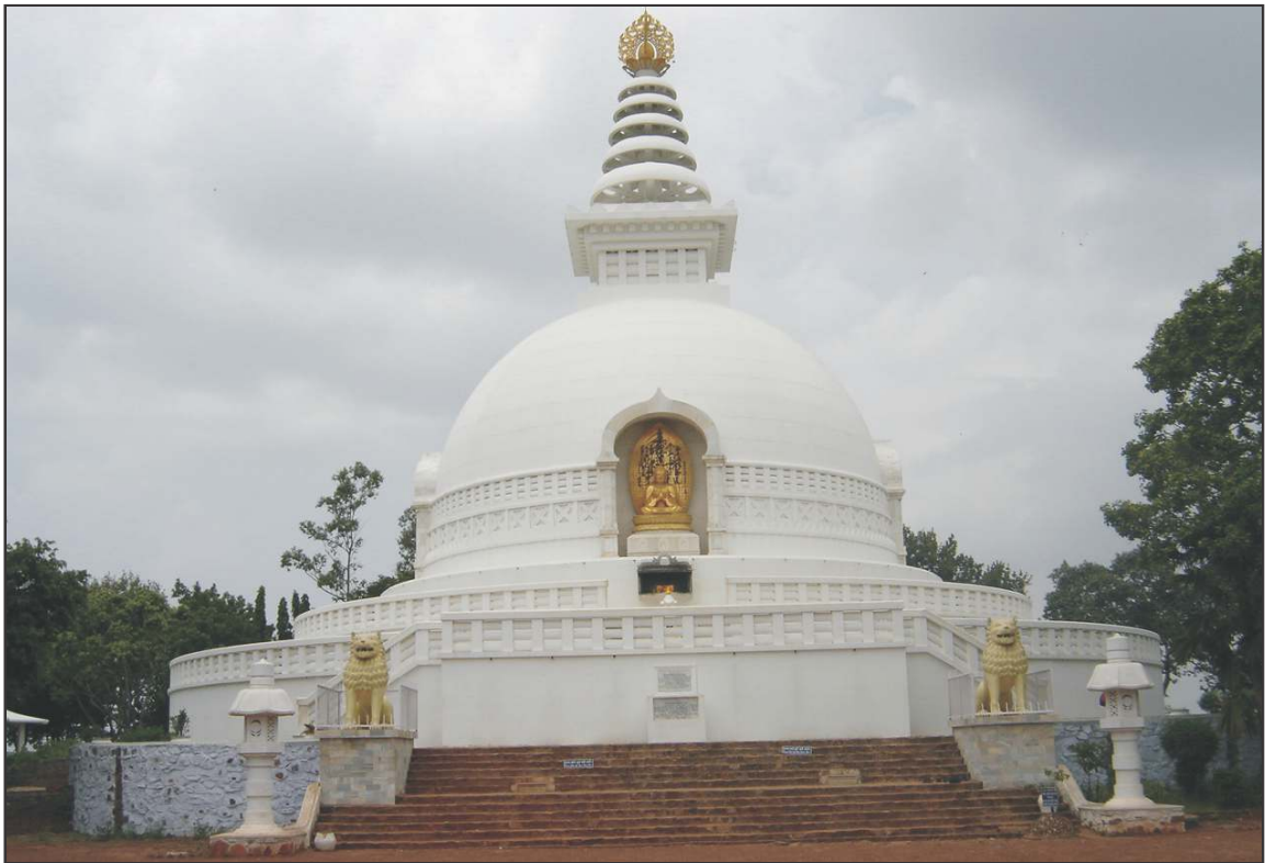
चित्र 9.3 शांतिस्तूप (राजगीर )

सबने खाना खाया। इसी क्रम में शिक्षक ने बताया कि राजगीर चारों ओर पहाड़ियों से घिरा हुआ है। इन पहाड़ियों में गंधक है इसलिए यहां से गर्म पानी का स्राव होता है। बच्चों ने मनियारमठ, जरासंध का अखाड़ा देखा तथा शांति स्तूप देखने रज्जू मार्ग द्वारा (रोप-वे) पहाड़ी की ओर चल पड़े।