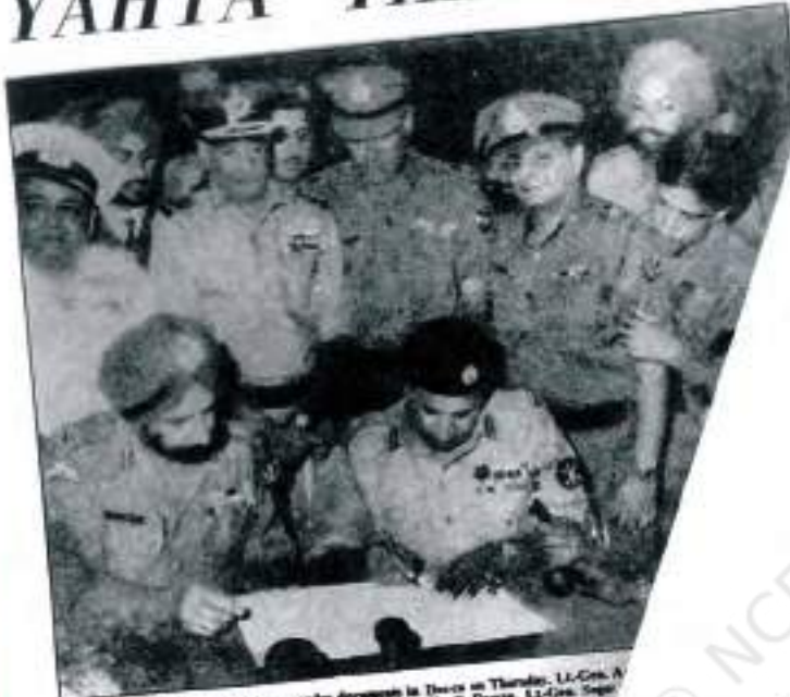
Gen. A. A. K. Niazi signing the surrender document in Dhaka on Thursday. Lt.-Gen. ...