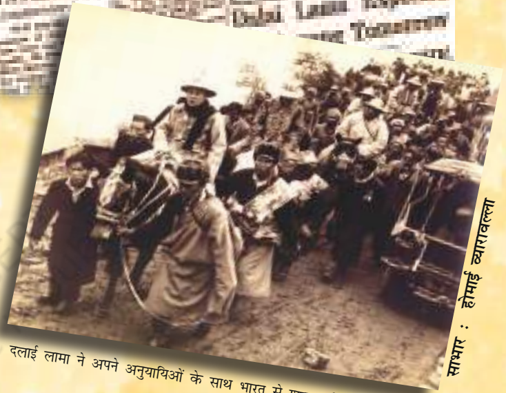
दलाई लामा ने अपने अनुयायियों के साथ भारत से शरण की माँग की।

चीन ने 'स्वायत्त तिब्बत क्षेत्र' बनाया है और इस इलाके को वह चीन का अभिन्न अंग मानता है। तिब्बती जनता चीन के इस दावे को नहीं मानती कि तिब्बत चीन का अभिन्न अंग है। ज्यादा से ज्यादा संख्या में चीनी बाशिंदों को तिब्बत लाकर वहाँ बसाने की चीन की नीति का तिब्बती जनता ने विरोध किया। तिब्बती चीन के इस दावे को भी नकारते हैं कि तिब्बत को स्वायत्तता दी गई है। वे मानते हैं कि तिब्बत की पारंपरिक संस्कृति और धर्म को नष्ट करके चीन वहाँ साम्यवाद फैलाना चाहता है।