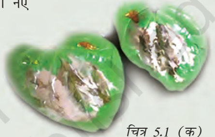
चित्र 5.1 (क) पान के पत्ते

महिलाओं और पुरुषों ने कार्य की तलाश में, प्राकृतिक आपदाओं से बचाव के लिए व्यापारियों, सैनिकों, पुरोहितों और तीर्थयात्रियों के रूप में या फिर साहस की भावना से प्रेरित होकर यात्राएँ की हैं। वे, जो किसी नए स्थान पर आते हैं अथवा बस जाते हैं, निश्चित रूप से एक ऐसी दुनिया को समझ पाते हैं जो भूदृश्य या भौतिक परिवेश के संदर्भ में और साथ ही लोगों की प्रथाओं, भाषाओं, आस्था तथा व्यवहार में भिन्न होती है। इनमें से कुछ इन भिन्नताओं के अनुरूप ढल जाते हैं और अन्य जो कुछ हद तक विशिष्ट होते हैं, इन्हें ध्यानपूर्वक अपने वृत्तांतों में लिख लेते हैं, जिनमें असामान्य तथा उल्लेखनीय बातों को अधिक महत्त्व दिया जाता है।