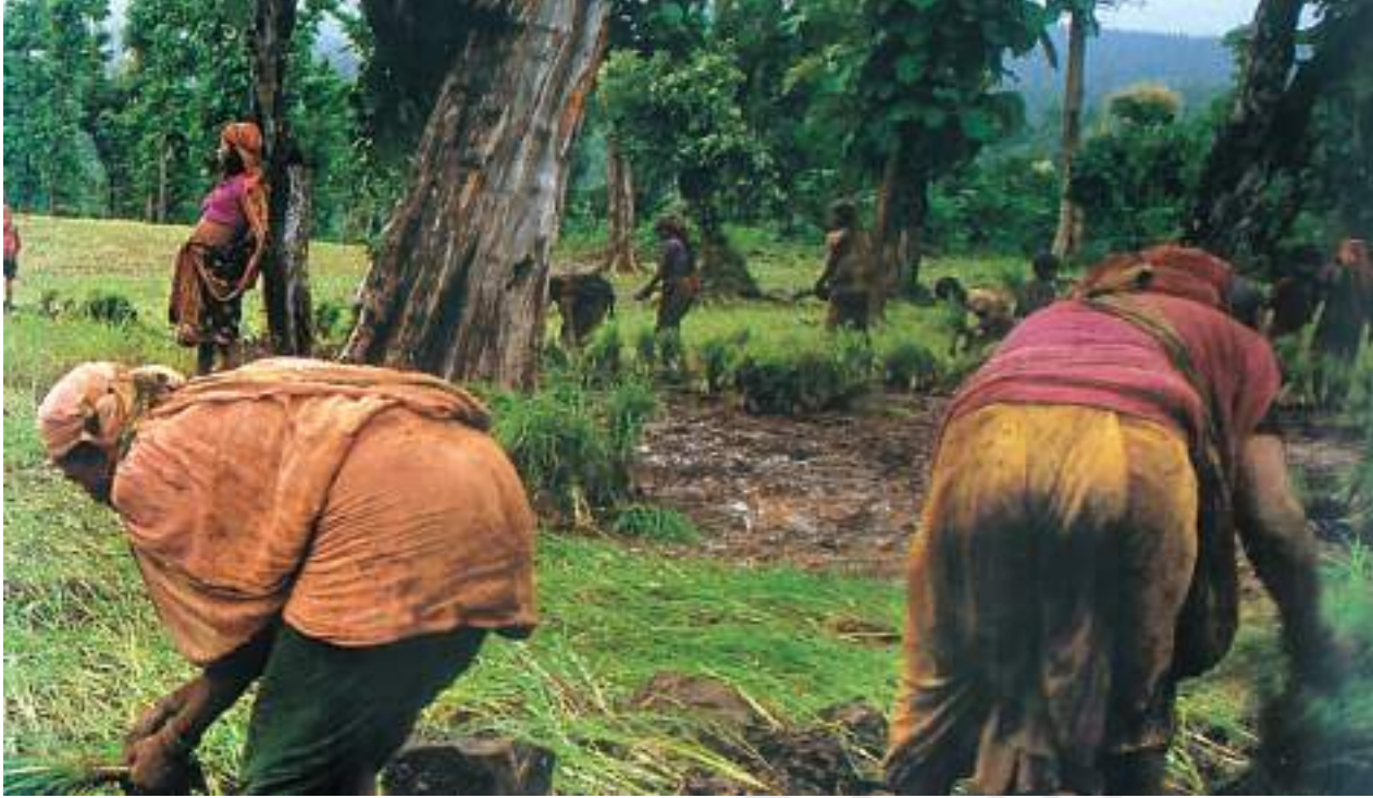
चित्र 6 - गुजरात के एक जंगल में खेती करती भील औरतें।

घुमंतू खेती गुजरात के बहुत सारे वन क्षेत्रों में अभी भी जारी है। आप देख सकते हैं कि यहाँ पेड़ों को काट दिया गया है और खेती के लिए ज़मीन साफ़ कर दी गई है।