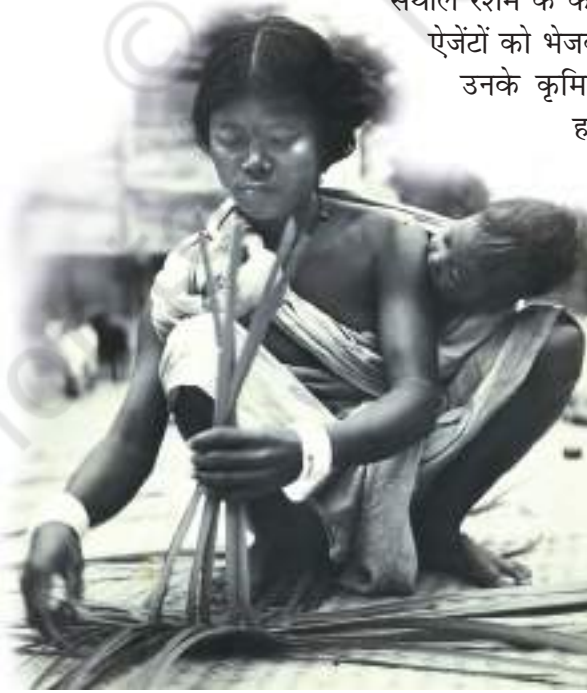
चित्र 9 - चटाई बुनती एक हाजाँग औरत

हजार कृमिकोषों के लिए 3-4 रुपए मिलते थे। इसके बाद इन कृमिकोषों को बर्दवान या गया भेज दिया जाता था जहाँ उन्हें पाँच गुना कीमत पर बेचा जाता था। निर्यातकों और रेशम उत्पादकों के बीच कड़ी का काम करने वाले बिचौलियों को जमकर मुनाफ़ा होता था। रेशम उत्पादकों को बहुत मामूली फ़ायदा मिलता था। स्वाभाविक है कि बहुत सारे आदिवासी समुदाय बाजार और व्यापारियों को अपना सबसे बड़ा दुश्मन मानने लगे थे।