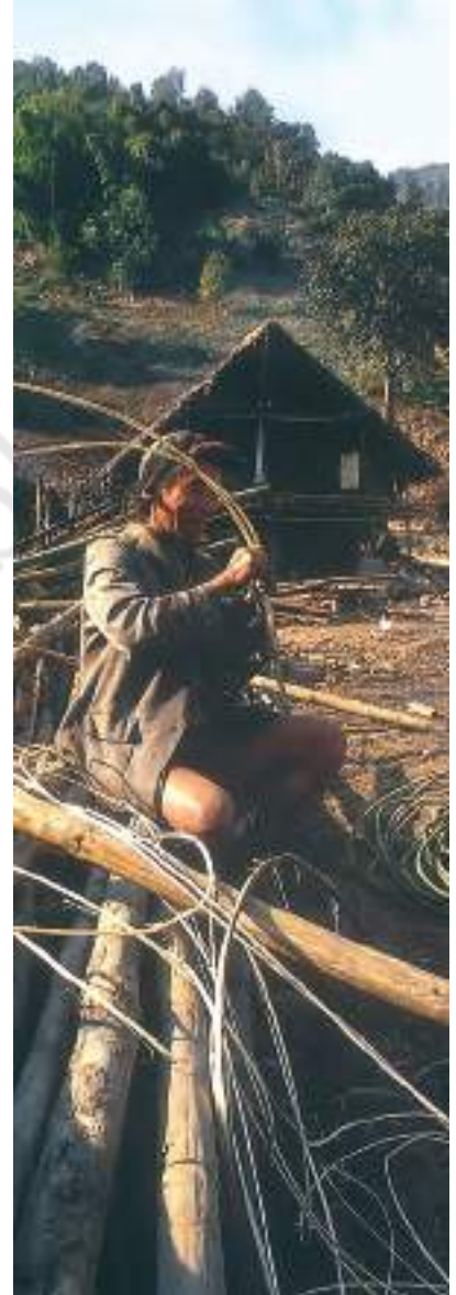
चित्र 5 - पूर्वोत्तर के निशी आदिवासियों के एक गाँव में लट्टों से बना घर। जब ये घर बनाए जाते हैं तो पूरा गाँव मदद करता है।

बेवड़ - मध्य प्रदेश में घुमंतू खेती के लिए इस्तेमाल होने वाला शब्द।