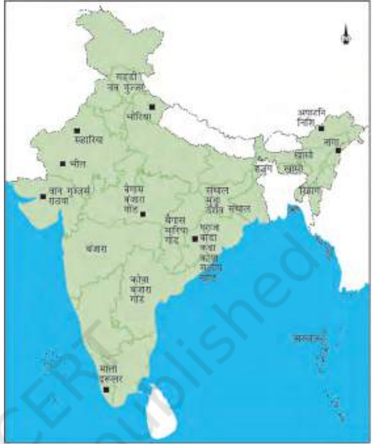
चित्र 3 - भारत में कुछ आदिवासी समुदायों के इलाके।

बहुत सारे आदिवासी समूह जानवर पालकर अपनी ज़िंदगी चलाते थे। वे चरवाहे थे जो मौसम के हिसाब से मवेशियों या भेड़ों के रेवड़ लेकर यहाँ से वहाँ जाते रहते थे। जब एक जगह घास खत्म हो जाती थी तो वे दूसरे इलाके में चले जाते थे। पंजाब के पहाड़ों में रहने वाले वन गुज्जर और आंध्र प्रदेश के लबाड़िया आदि समुदाय गाय-भैंस के झुंड पालते थे। कुल्लू के गद्दी समुदाय के लोग गड़रिये थे और कश्मीर के बकरवाल बकरियाँ पालते थे। अगले साल इतिहास की पाठ्यपुस्तक में आप उनके बारे में विस्तार से पढ़ेंगे।