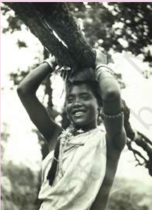
चित्र 4 - ईंधन की लकड़ी ले जाती एक संथाल लड़की, बिहार, 1946

वेरियर ऐल्विन द्वारा लिखित बैगा (1939) और ऐल्विन की अप्रकाशित रचना 'नोट्स ऑन द खोंड्स' (वेरियर ऐल्विन पेपर्स, नेहरू स्मृति संग्रहालय एवं पुस्तकालय) पर आधारित