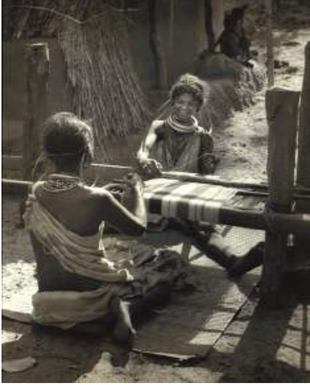
चित्र 8 - गोदासा औरतें बुनाई करती हुई।

अच्छी गुणवत्ता सबको आकर्षित करती थी और भारत का निर्यात तेजी से बढ़ रहा था। जैसे-जैसे बाजार फैला ईस्ट इंडिया कंपनी के अफसर इस माँग को पूरा करने के लिए रेशम उत्पादन पर जोर देने लगे।