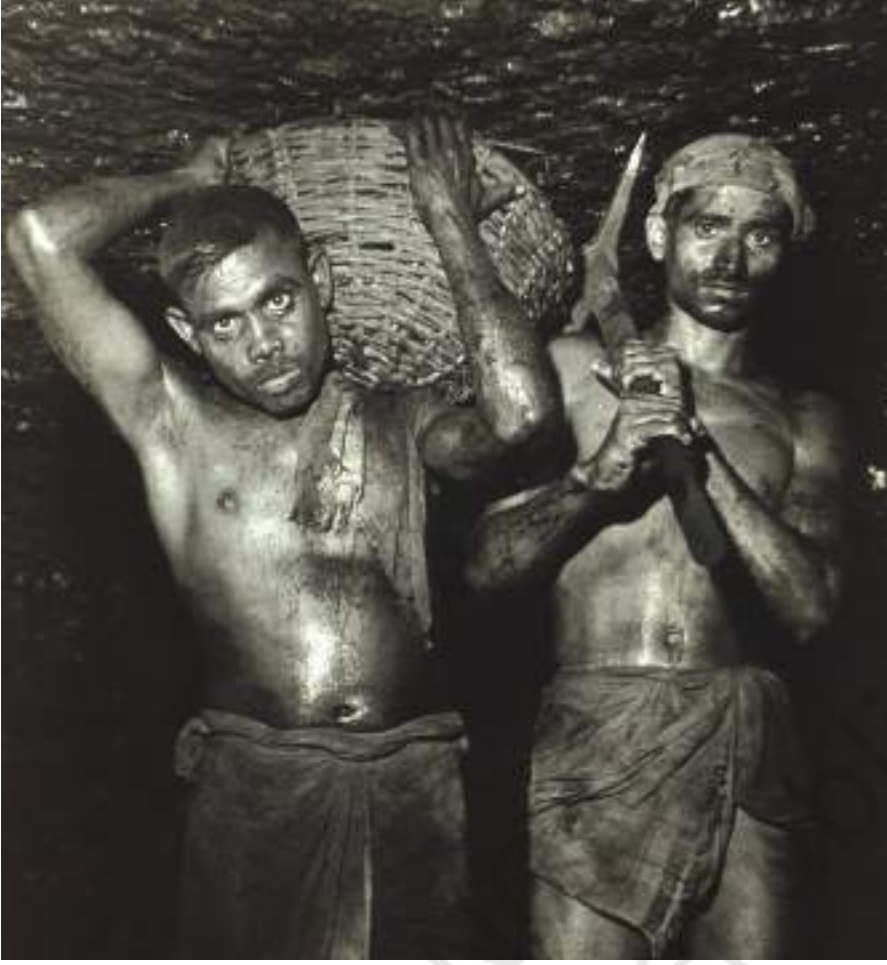
चित्र 10 - बिहार के कोयला खनिक, 1948.

1920 के दशक में बिहार की झरिया और रानीगंज कोयला खदानों में काम करने वाले लगभग 50 प्रतिशत खनिक आदिवासी थे। अंधेरी और दमघोंटू खदानों की गहराई में काम करना न केवल शरीर को तोड़ता था बल्कि यह खतरनाक था। वह अकसर सचमुच जान ले लेता था। 1920 के दशक में देश की कोयला खदानों में हर साल 2,000 से ज्यादा मजदूर मारे जाते थे।