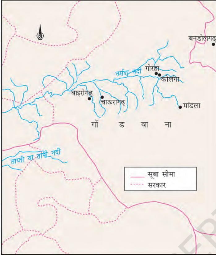
मानचित्र 2 गोंडवाना

जाता था। चौरासी का उप-विभाजन बरहोतों में होता था, जो बारह-बारह गाँवों को मिला कर बनते थे।