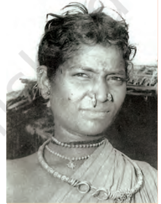
चित्र 5 गोंड महिला

इन राज्यों की प्रशासनिक व्यवस्था केंद्रीकृत हो रही थी। राज्य, गढ़ों में विभाजित थे। हर गढ़ किसी खास गोंड कुल के नियंत्रण में था। ये पुनः चौरासी गाँवों की इकाइयों में विभाजित होते थे, जिन्हें चौरासी कहा