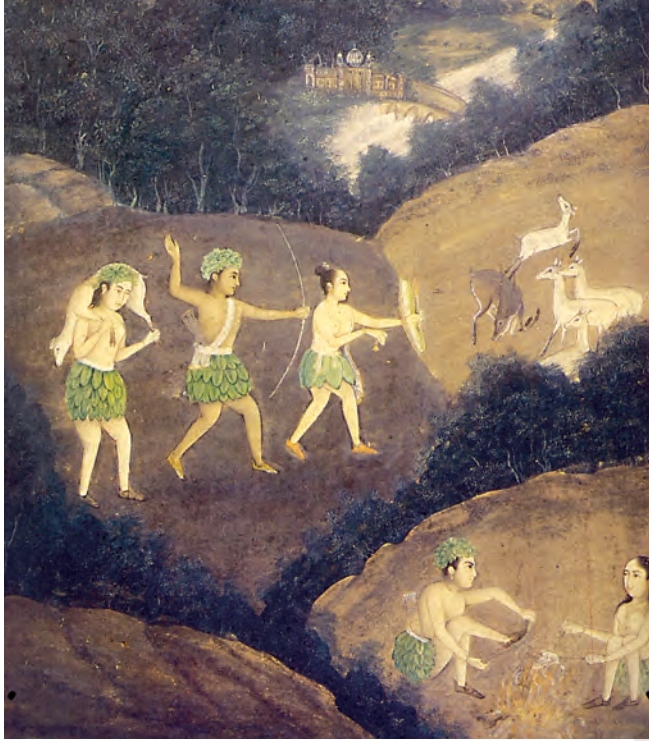
चित्र 2 रात में भील लोग हिरन का शिकार कर रहे हैं।