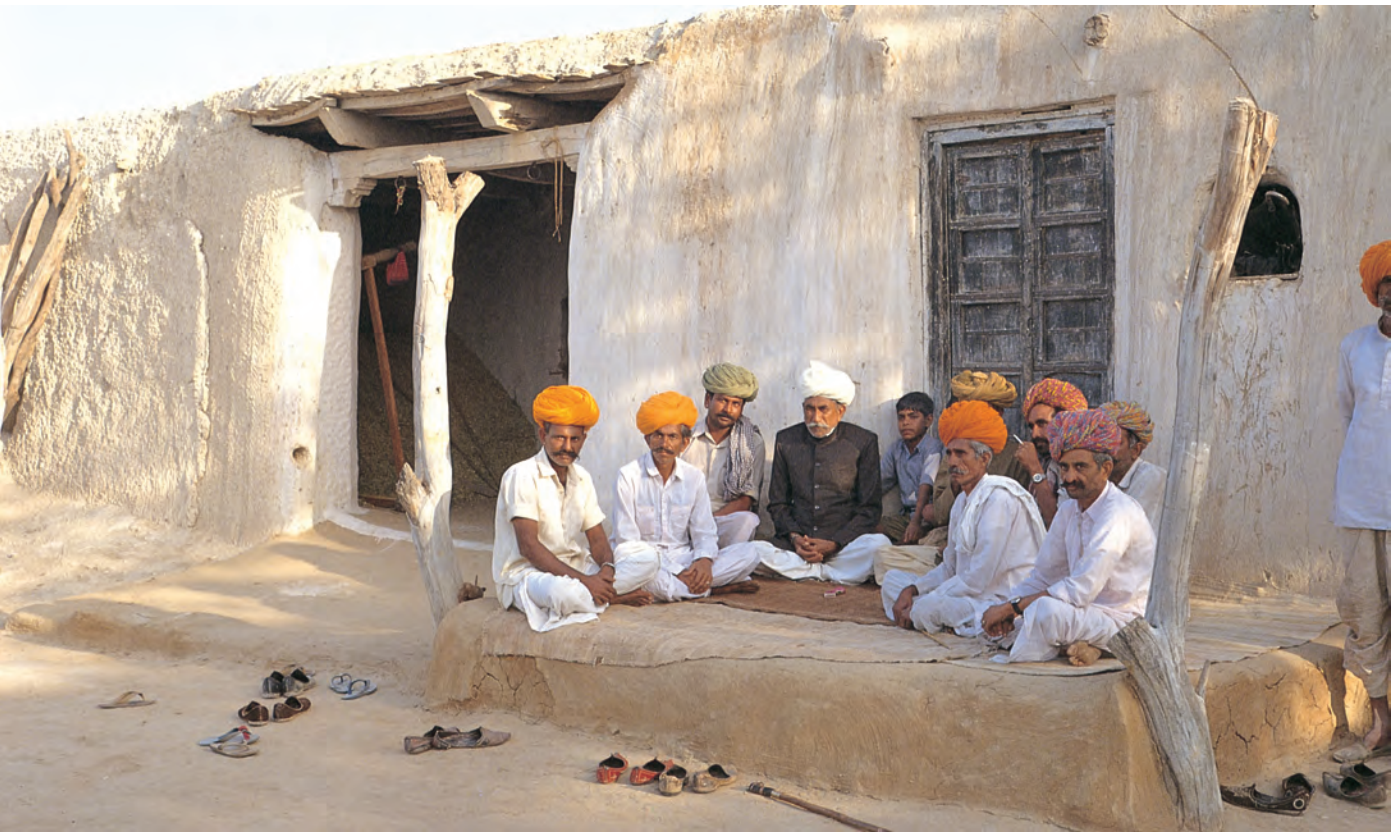
चित्र 9 - मारू राइकाओं की वंशावली बताने वाला.

वंशावली बताने वाला समुदाय का इतिहास बताता है। इस तरह की मौखिक परंपराओं से चरवाहा समुदायों को अपनी पहचान का भाव मिलता है। इन परंपराओं से हम यह पता लगा सकते हैं कि कोई समूह अपने अतीत को किस तरह देखता है।