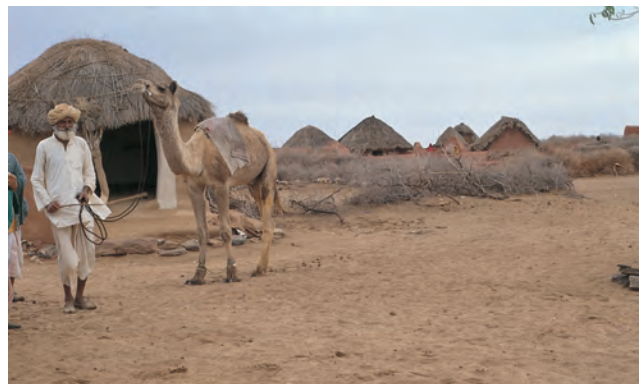
चित्र 6 - अपने ऊँट के साथ एक ऊँटपालक.

यह राजस्थान में जैसलमेर के निकट थार का रेगिस्तान है। इस इलाके के ऊँट पालकों को मारू (रेगिस्तान) राइका और उनकी बस्ती को ढंडी कहा जाता है।