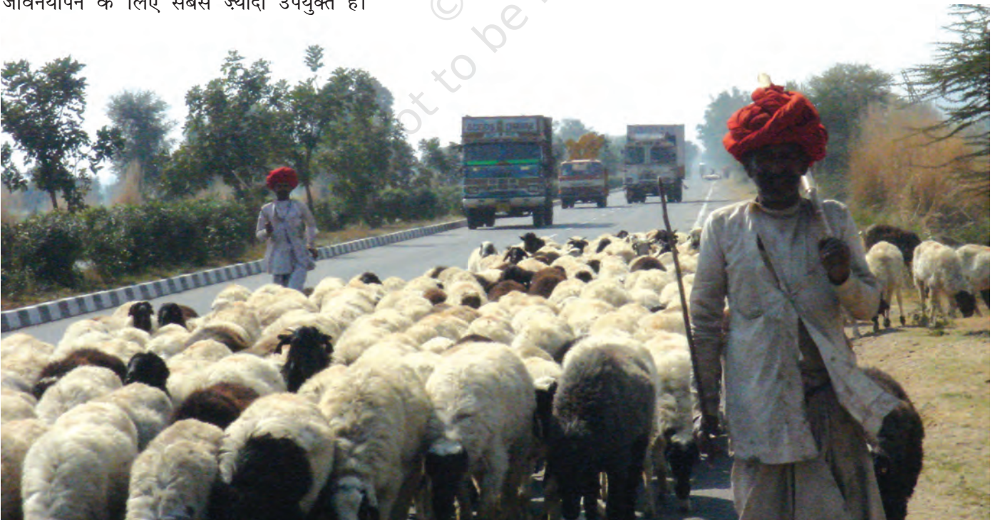
चित्र 18 - जयपुर राजमार्ग पर राइका गड़रिये.

चरवाहे अतीत के अवशेष नहीं हैं। वे ऐसे लोग नहीं हैं जिनके लिए आज की आधुनिक दुनिया में कोई जगह नहीं है। पर्यावरणवादी और अर्थशास्त्री अब इस बात को काफ़ी गंभीरता से मानने लगे हैं कि घुमंतू चरवाहों की जीवनशैली दुनिया के बहुत सारे पहाड़ी और सूखे इलाकों में जीवनयापन के लिए सबसे ज्यादा उपयुक्त है।