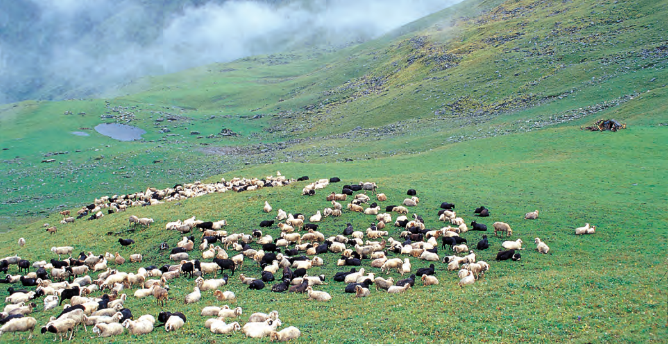
चित्र 1 - पूर्वी गढ़वाल के बुग्याल में चरती भेड़ें.

बुग्याल ऊँचे पहाड़ों पर 12,000 फुट से भी ज्यादा ऊँचाई पर स्थित विशाल प्राकृतिक चरागाह होते हैं। जाड़ों में ये बर्फ से ढके रहते हैं और अप्रैल के बाद हरे-भरे हो जाते हैं। इस समय पहाड़ियों की तलहटी तरह-तरह की घास, जड़ों और जड़ी-बूटियों से भरी रहती है। मॉनसून तक इन चरागाहों में घनी हरियाली छा जाती है और चारों तरफ फूल ही फूल दिखाई देने लगते हैं।