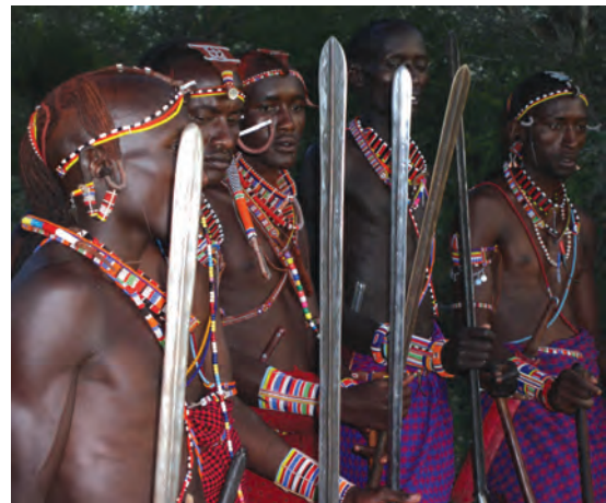
चित्र 16 - योद्धा गहरे लाल रंग की शुका और चमकदार मोतियों के आभूषण पहनते हैं तथा स्टील की नोक वाला पाँच फुट लंबा भाला रखते हैं। बारीकी से सँवारे गए उनके बाल गेरू से रंगे होते हैं। उगते सूरज को सम्मान देने के लिए वे पूर्व की ओर मुँह करके खड़े होते हैं। योद्धा अपने समुदाय की रक्षा करते हैं और लड़के पशुओं को चराते हैं। सूखे के मौसम में योद्धा और लड़के, दोनों ही पशु चराते हैं।

औपनिवेशिक काल में अफ्रीका के बाकी स्थानों की तरह मासाइलैंड में भी आए बदलावों से सारे चरवाहों पर एक जैसा असर नहीं पड़ा। उपनिवेश बनने से पहले मासाई समाज दो सामाजिक श्रेणियों में बँटा हुआ था – वरिष्ठ जन (एल्डर्स) और योद्धा (वॉरियर्स)। वरिष्ठ जन शासन चलाते थे। समुदाय से जुड़े मामलों पर विचार-विमर्श करने और अहम फैसले लेने के लिए वे समय-समय पर सभा करते थे। योद्धाओं में ज्यादातर नौजवान होते थे जिन्हें मुख्य रूप से लड़ाई लड़ने और कबीले की हिफाजत करने के लिए तैयार किया जाता था। वे समुदाय की रक्षा करते थे और दूसरे कबीलों के मवेशी छीन कर लाते थे। जहाँ जानवर ही संपत्ति हो वहाँ हमला करके दूसरों के जानवर छीन लेना एक महत्वपूर्ण काम होता था। अलग-अलग चरवाहा समुदायों की ताकत इन्हीं हमलों से तय होती थी। युवाओं को योद्धा वर्ग का हिस्सा तभी माना जाता था जब वे दूसरे समूह के मवेशियों को छीन कर और