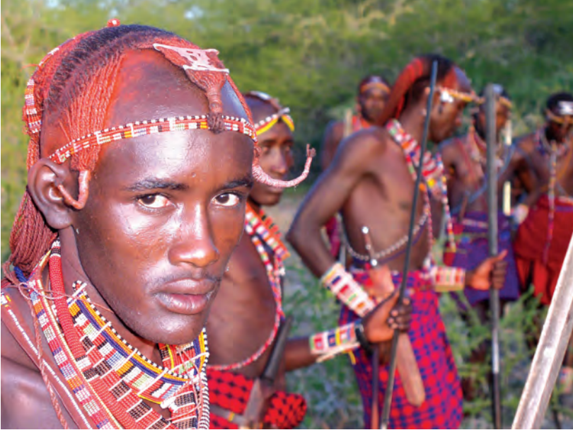
चित्र 17 - आज भी योद्धा बनने के लिए युवकों को व्यापक अनुष्ठानों से गुजरना पड़ता है हालाँकि अब यह प्रथा पहले जैसी प्रचलित नहीं है। इसके लिए युवकों को लगभग चार माह तक अपने कबीले के इलाके का दौरा करना पड़ता है। इस यात्रा के अंत में वे छापामारों की तरह दौड़कर अपने अहाते में घुसते हैं। इस समारोह के मौके पर युवक ढीले कपड़े पहनते हैं और पूरे दिन नाचते रहते हैं। इस अनुष्ठान के साथ ही वे जीवन के एक नए चरण में पहुँच जाते हैं। लड़कियों को इस तरह के अनुष्ठानों से नहीं गुजरना पड़ता।

युद्ध में बहादुरी का प्रदर्शन करके अपनी मर्दानगी साबित कर देते थे। फिर भी वे वरिष्ठ जनों के नीचे रह कर ही काम करते थे।