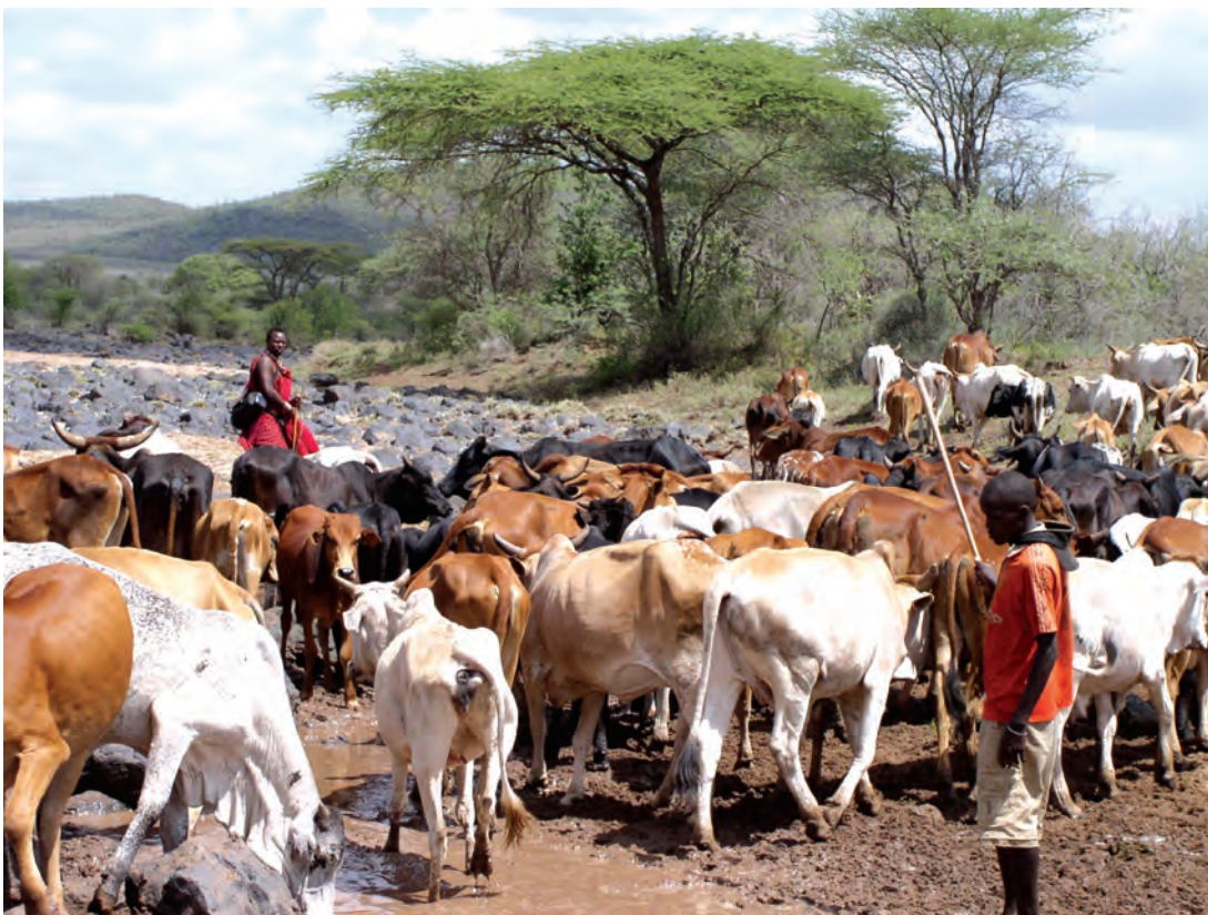
चित्र 15 - मासाई नाम 'मा' शब्द से निकला है। मा-साई का मतलब होता है 'मेरे लोग'। परंपरागत रूप से मासाई घुमंतू और चरवाहा समुदाय के लोग होते हैं जो अपनी आजीविका के लिए दूध और मांस पर आश्रित रहते हैं। ऊँचे तापमान और कम वर्षा के कारण यहाँ शुष्क, धूल भरे और बेहद गर्म हालात रहते हैं। इस अर्ध-शुष्क विषुववृत्तीय इलाके में सूखे के हालात सामान्य हैं। ऐसे समय में बहुत सारे जानवर मर जाते हैं।