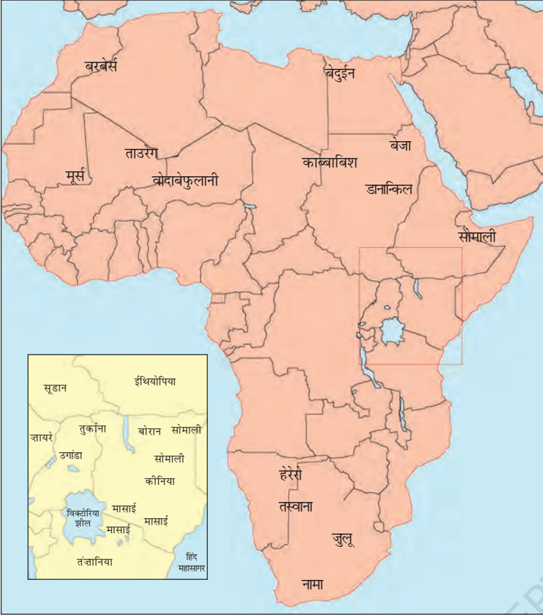
चित्र 13 - अफ़्रीका के चरवाहा समुदाय.

छोटी तस्वीर (इनसेट) में कीनिया और तंज़ानिया में मासाइयों का इलाका दर्शाया गया है।