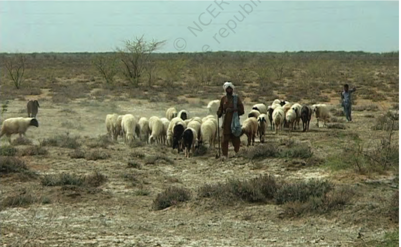
चित्र 10 - चरागाहों की तलाश में निकले मालधारी चरवाहे। उनके गाँव कच्छ की रन में स्थित हैं।

वंशावली बताने वाला समुदाय का इतिहास बताता है। इस तरह की मौखिक परंपराओं से चरवाहा समुदायों को अपनी पहचान का भाव मिलता है। इन परंपराओं से हम यह पता लगा सकते हैं कि कोई समूह अपने अतीत को किस तरह देखता है।