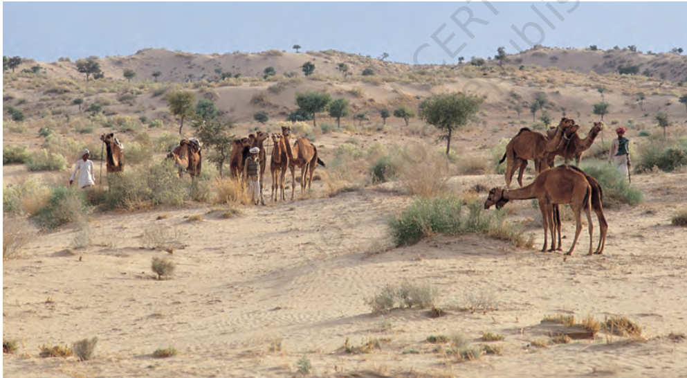
चित्र 5 - पश्चिमी राजस्थान के थार रेगिस्तान में चरते राइका समुदाय के ऊँट.

धंगर महाराष्ट्र का एक जाना-माना चरवाहा समुदाय है। बीसवीं सदी की शुरुआत में इस समुदाय की आबादी लगभग 4,67,000 थी। उनमें से ज्यादातर गड़रिये या चरवाहे थे हालाँकि कुछ लोग कम्बल और चादरें भी बनाते थे जबकि कुछ भैंस पालते थे। धंगर गड़रिये बरसात के दिनों में महाराष्ट्र के मध्य पठारों में रहते थे। यह एक अर्ध-शुष्क इलाका था जहाँ बारिश बहुत कम होती थी और मिट्टी भी खास उपजाऊ नहीं थी। चारों तरफ सिर्फ कंटैली झाड़ियाँ होती थीं। बाजरे जैसी सूखी फ़सलों के अलावा यहाँ और कुछ नहीं उगता था। मॉनसून में यह पट्टी धंगरों के जानवरों के लिए एक विशाल चरागाह बन जाती थी। अक्टूबर के आसपास धंगर बाजरे की कटाई करते थे और चरागाहों की तलाश में पश्चिम की तरफ चल पड़ते थे। करीब महीने भर पैदल चलने के बाद वे अपने रेवड़ों के साथ कोंकण के इलाके में जाकर डेरा डाल देते थे। अच्छी बारिश और उपजाऊ मिट्टी की बदौलत इस इलाके में खेती खूब होती थी। कोंकणी किसान भी इन चरवाहों का दिल खोलकर स्वागत करते थे। जिस समय धंगर कोंकण पहुँचते थे उसी समय कोंकण के किसानों को खरीफ़ की फ़सल काट कर अपने खेतों को रबी की फ़सल के लिए दोबारा उपजाऊ बनाना होता था।