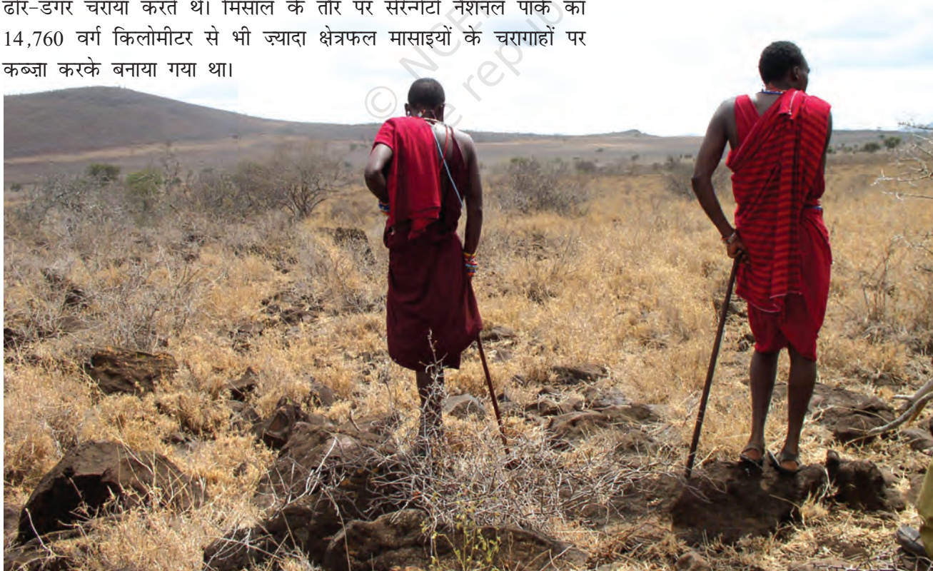
चित्र 14 - घास के बिना पशु (मवेशी, बकरियाँ और भेड़ें) कुपोषण का शिकार हो जाते हैं जिसका मतलब है कि चरवाहों के परिवारों और बच्चों के लिए भोजन कम पड़ने लगता है। सूखे और भोजन की सर्वाधिक कमी से ग्रस्त इलाका अम्बोसेली नैशनल पार्क के आसपास पड़ता है जिसकी पर्यटन से होने वाली आय पिछले साल लगभग 24 करोड़ कीनियन शिलिंग (लगभग 35 लाख अमेरिकी डॉलर) थी। किलिमंजारो जल परियोजना भी इसी इलाके से होकर जाती है लेकिन यहाँ रहने वाले समुदाय न तो पीने के लिए और न ही सिंचाई के लिए इस परियोजना के पानी का इस्तेमाल कर सकते हैं।

बहुत सारे चरागाहों को शिकारगाह बना दिया गया। कीनिया में मासाई मारा व साम्बुरू नैशनल पार्क और तंज़ानिया में सेरेन्गेटी पार्क जैसे शिकारगाह इसी तरह अस्तित्व में आए थे। इन आरक्षित जंगलों में चरवाहों का आना मना था। इन इलाकों में न तो वे शिकार कर सकते थे और न अपने जानवरों को चरा सकते थे। ऐसे बहुत सारे आरक्षित जंगलों में अब तक मासाई अपने ढोर-डंगर चराया करते थे। मिसाल के तौर पर सेरेन्गेटी नैशनल पार्क का 14,760 वर्ग किलोमीटर से भी ज़्यादा क्षेत्रफल मासाइयों के चरागाहों पर कब्ज़ा करके बनाया गया था।