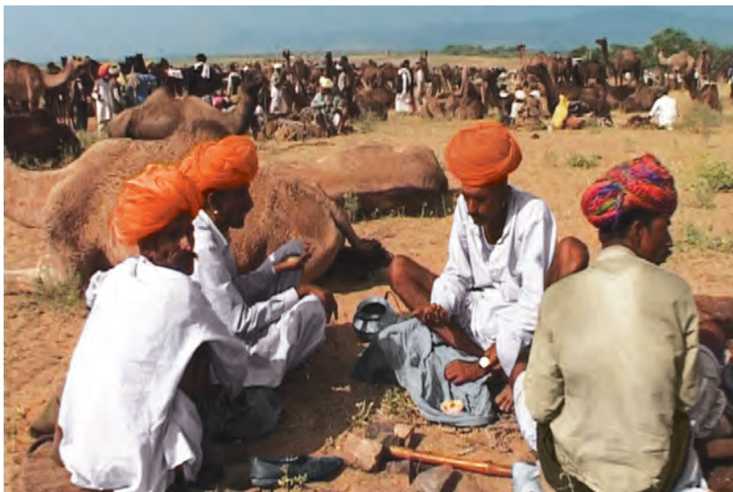
चित्र 8 - पुष्कर का ऊँट मेला.

आइए, अब देखें कि औपनिवेशिक शासन के दौरान यानी अंग्रेज़ों के ज़माने में चरवाहों का जीवन किस तरह बदला?