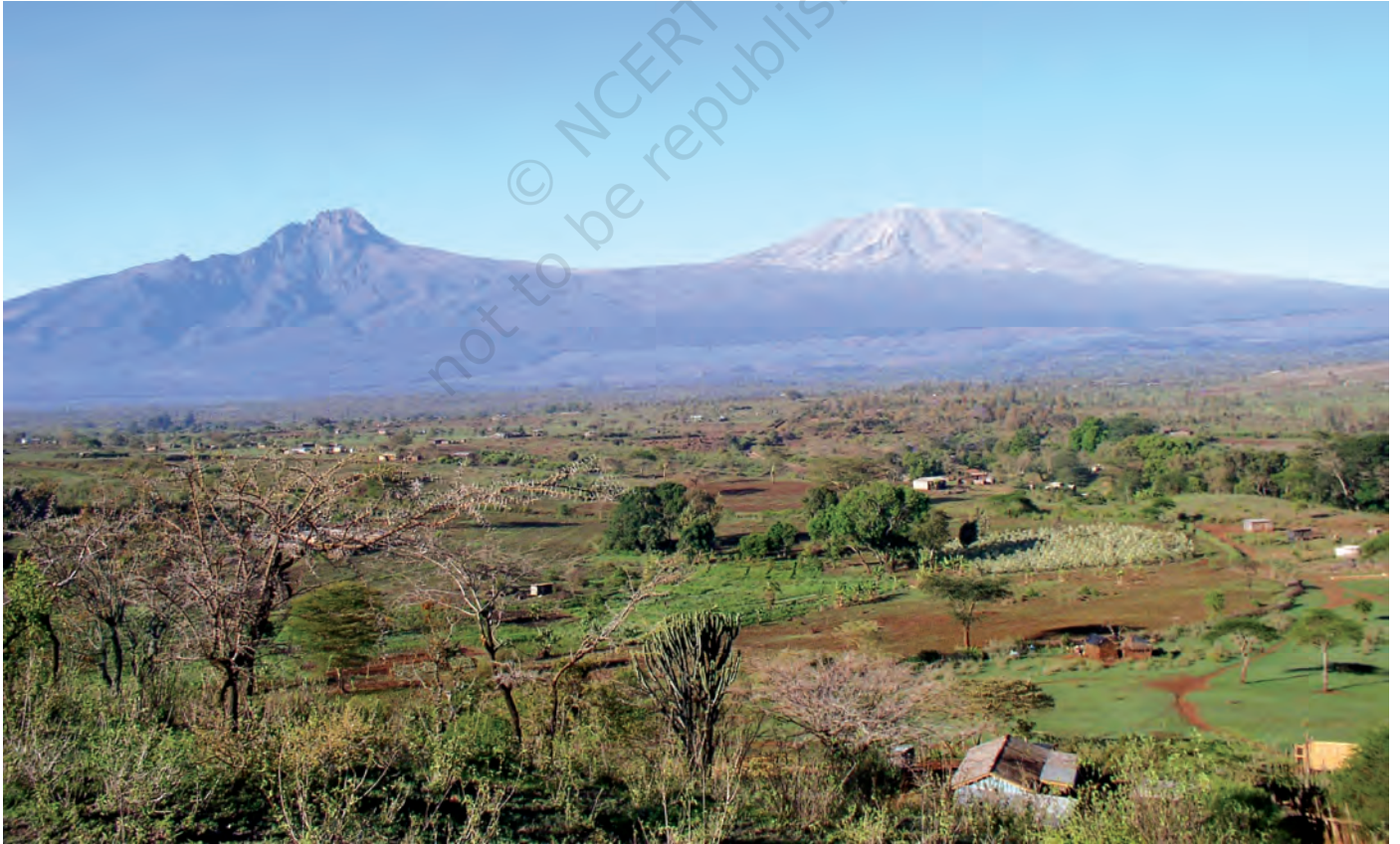
चित्र 12 - मासाई लैंड जिसके पीछे किलिमंजारो पहाड़ दिखाई दे रहे हैं.

हिंदुस्तान की तरह अफ्रीकी चरवाहों की ज़िंदगी में भी औपनिवेशिक और उत्तर-औपनिवेशिक काल में गहरे बदलाव आए हैं। आखिर क्या थे ये बदलाव?