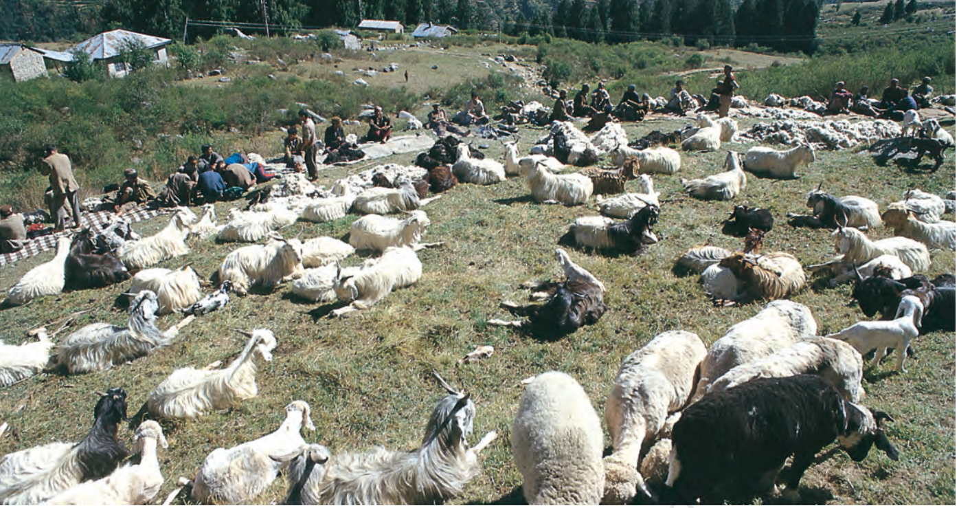
चित्र 3 - ऊन उतरने का इंतज़ार। हिमाचल प्रदेश स्थित पालमपुर के पास उहल घाटी।

और स्पीति के गाँवों में एक बार फिर कुछ समय के लिए रुकते। इस बीच वे गर्मियों की फ़सलें काटते और सर्दियों की फ़सलों की बुवाई करके आगे बढ़ जाते। यहाँ से वे अपने रेवड़ लेकर शिवालिक की पहाड़ियों में जाड़ों वाले चरागाहों में चले जाते और अगली अप्रैल में भेड़-बकरियाँ लेकर वे दोबारा गर्मियों के चरागाहों की तरफ़ रवाना हो जाते।