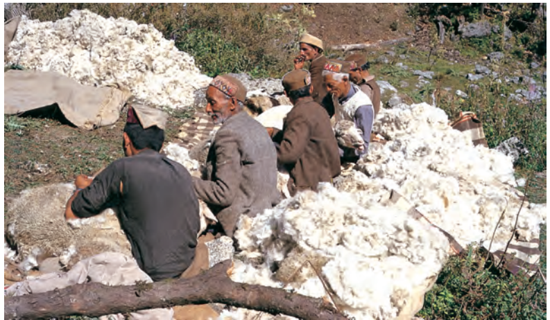
चित्र 4 - गद्दी भेड़ों की ऊन उतार रहे हैं।

भाबर : गढ़वाल और कुमाऊँ के इलाके में पहाड़ियों के निचले हिस्से के आसपास पाए जाने वाला शुष्क या सूखे जंगल का इलाका। बुग्याल : ऊँचे पहाड़ों में स्थित घास के मैदान।