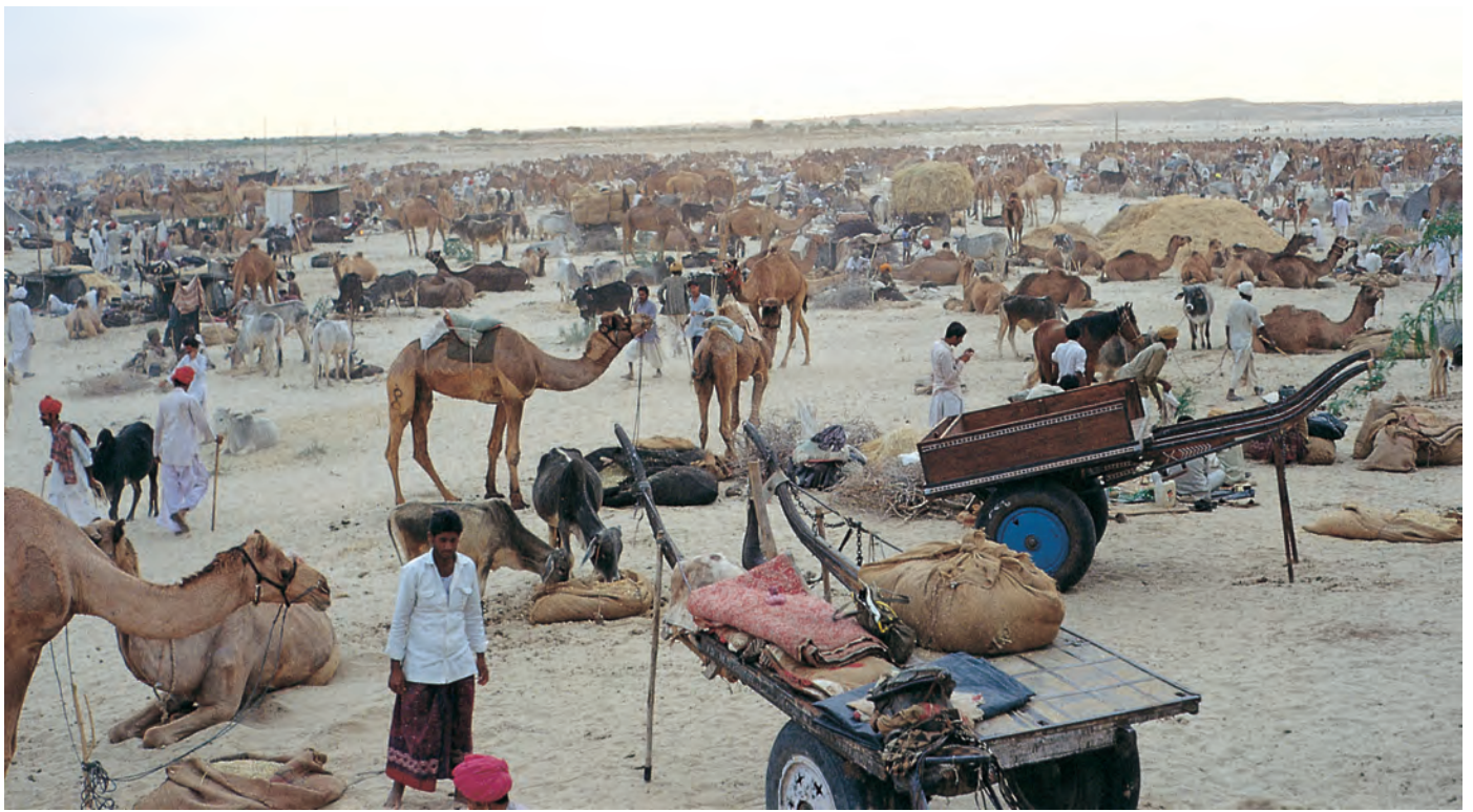
चित्र 7 - पश्चिमी राजस्थान में बलोतरा स्थित ऊँट मेला.

ऊँटपालक यहाँ ऊँटों की खरीद-फ़रोख़ा के लिए आते हैं। मेले में मारू राइका ऊँटों के प्रशिक्षण में अपनी महारत का भी प्रदर्शन करते हैं। इस मेले में गुजरात से घोड़े भी लाए जाते हैं।