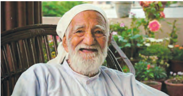
पर्यावरणवादी सुंदरलाल बहुगुणा

तथापि, लोकसांख्यिकीय आणि आर्थिक कारणांमुळे जंगलांचा असंयुक्तिक वापर होऊन जंगलतोड झाली. औद्योगिकीकरण आणि विकासाच्या प्रक्रियांमुळे वाहतूक व दळणवळणाच्या साधनांमध्ये सुधारणा झाली. विकासकामांमुळे जंगलांवरील मूळ रहिवाशांच्या हक्कावर गदा आली. उपजीविकेचे साधन नष्ट होत असलेले पाहून मूळ रहिवाशी संतप्त झाले आणि या चळवळीला सुरुवात झाली. एप्रिल १९७३ मध्ये जेव्हा कंत्राटदार कामगारांसह मंडल या गावी त्यांना राज्य सरकारने दिलेली जंगलाची जागा मोकळी करण्यासाठी आणि झाडे तोडण्यासाठी पोहचले, तेव्हा त्यांचा प्रतिकार करण्यासाठी आणि निषेध करण्यासाठी रहिवाशांनी झाडांना मिठी मारली. हा निषेध इतक्या मोठ्या प्रमाणावर घडला की परिणामी कंत्राटदार व सरकारी अधिकाऱ्यांना माघार घ्यावी लागली. या निषेधात गावातील महिलाही सहभागी झाल्या. या घटनेमुळे जंगलतोडविरोधात निषेध करणाऱ्या अशाच प्रकारच्या इतर अनेक गटांचे मनोबल वाढले.