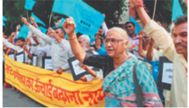
मेधा पाटकर आणि निदर्शक

जवाहरलाल नेहरू धरणांना 'आधुनिक भारताची मंदिरे' म्हणून संबोधत. स्वातंत्र्योत्तर काळात मोठ्या प्रमाणात अनेक धरणांचे प्रकल्प मंजूर झाले. धरण बांधण्यामागील चांगला हेतू कधीही नाकारला जाऊ शकत नाही. परंतु, बहुतांश घटनांमध्ये धरणे बांधण्याचा अपरिहार्य परिणाम म्हणजे विस्थापन होय. विस्थापनामुळे आदिवासींचे जीवनमान नष्ट होते.