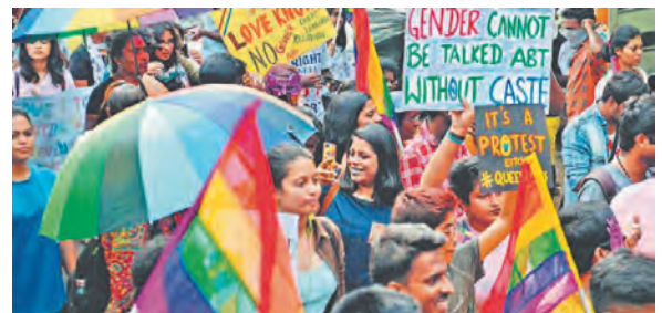
लिंगभाव आधारित विविधता