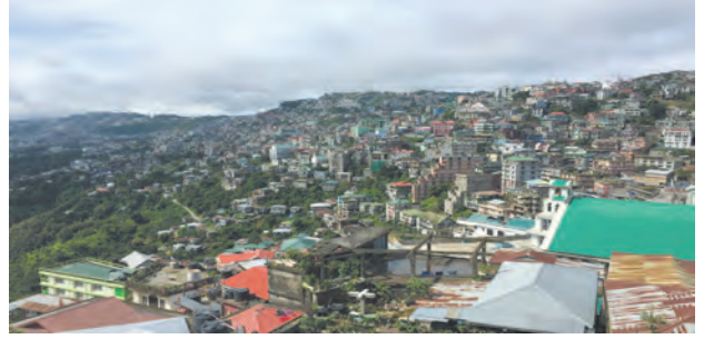
शहरी भागातील लोकसंख्येची घनता

ही या शहरी मानवी वसाहतीची वैशिष्ट्ये होत. शहरे, नगरे आणि उपनगरे असे शहरी भागाचे वर्गीकरण केले जाते.