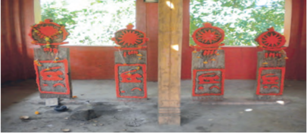
“वाघोबा मंदिर” (सूर्यदेवतेचे मंदिर) कासटवाडी गाव, जवाहर तालुका, जिल्हा पालघर