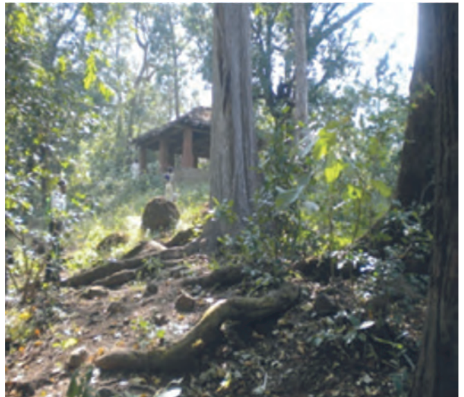
“शेडोबाचे वन” तालुका मुर्बाड, जिल्हा ठाणे येथील देवराई