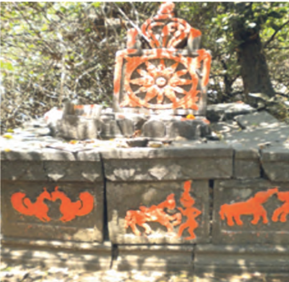
“सूर्यदेव मंदिर” (सूर्यदेवतेचे मंदिर) कासटवाडी गाव, जवाहर तालुका, जिल्हा पालघर

(७) साधा धर्म : 'जीवात्मावाद' (पूर्वजांच्या आत्म्याचे पूजन), 'चेतनावाद' (दगड, लाकूड यांसारख्या कोणत्याही निर्जीव वस्तूंवरील श्रद्धा), 'कुलप्रतिकवाद' (पूर्वज म्हणून वृक्ष किंवा प्राण्याची श्रद्धा), आणि 'निसर्गवाद' (नदी, झरे, सूर्य, चंद्र, जंगल इत्यादी निसर्गशक्तींचे पूजन), मानववाद (एक अमूर्त अलौकिक वेगवान शक्ती) जी जगभर फिरू शकते आणि सजीव व निर्जीव वस्तूंमध्ये प्रवेश करून शक्ती प्रदान करते. हे आदिम जमातींच्या धर्माचे प्रकार होत. पवित्र वने हा आदिम समाजाचा अविभाज्य भाग आहे. काळी आणि पांढरी जादू, पूर्वजांचे पूजन, हितकारक आणि अपायकारक शक्ती यावर आदिम समाजाचा विश्वास आहे.