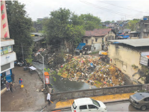
शहरातील कचऱ्याची विल्हेवाट लावण्याची समस्या

(९) कचऱ्याची विल्हेवाट : भारतातील शहरांची संख्या आणि आकारमान वाढल्यामुळे कचरा विनियोगाची समस्या गंभीर बनली आहे. शहरांमध्ये निर्माण होणारा प्रचंड कचरा आरोग्यास हानिकारक आहे.