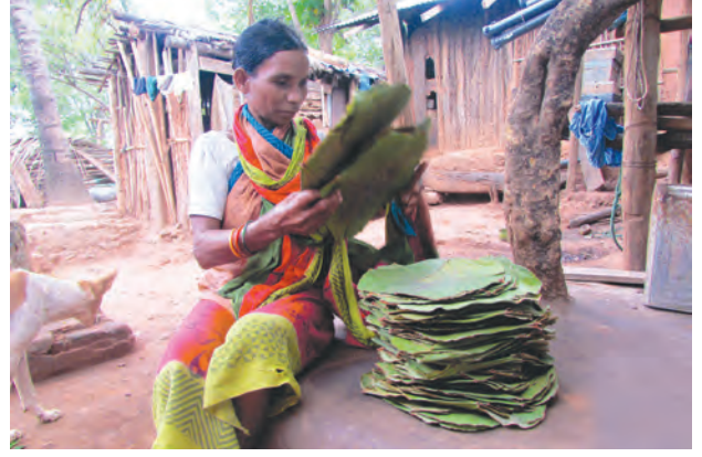
आदिवासींचे आर्थिक जीवन

श्रद्धांवर आधारित आहेत. फार पूर्वीपासून त्यांचा इतर संस्कृती किंवा लोकांशी फारसा संपर्क आलेला नाही.