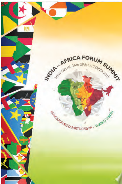
भारत-आफ्रिका शिखर परिषद, नवी दिल्ली, २०१५

१९५० आणि १९६० च्या दशकात आफ्रिकेतील वसाहतवादविरोधी, राष्ट्रीय स्वातंत्र्याच्या चळवळी आणि तेथील भारतीय वंशाचे लोक हे भारताच्या आफ्रिका धोरणाचे लक्ष्य होते. भारताने वर्णभेदाच्या विरोधातील लढाईला समर्थन दिले आणि विविध संस्थांमार्फत आफ्रिकेतील स्वातंत्र्यचळवळींना मदत केली. ह्यारे