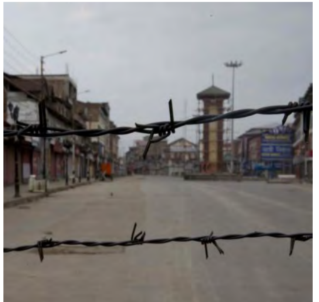
लाल चौक, श्रीनगर - दोन भिन्न रूपे