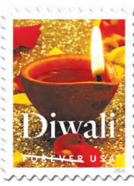
अमेरिकन डाक सेवेचे दिवाळी निमित्त काढलेले पोस्टाचे तिकीट

२००८ च्या नागरी आण्विक सहकार्य करारान्वये भारताने अणुप्रकल्पांचे 'नागरी' आणि 'लष्करी' असे विभाजन करून नागरी अणुप्रकल्प आंतरराष्ट्रीय अणुउर्जा आयोगाच्या देखरेखी खाली आणले. त्याबदल्यात अमेरिकेने भारताच्या नागरी अणुप्रकल्पांबरोबर संपूर्ण सहकार्य करण्याचे मान्य केले; ज्यामुळे भारत हा अण्वस्त्र प्रसारबंदी कराराच्या बाहेर राहूनही अण्वस्त्र क्षमता बाळगू शकणारा आणि आण्विक व्यापारात सहभागी होऊ शकणारा एकमेव देश झाला आहे.