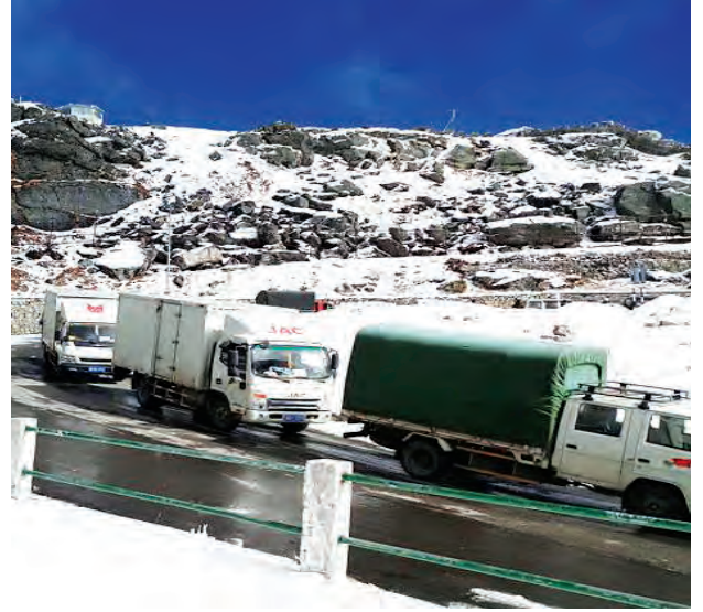
भारत-चीन दरम्यानच्या सीमेलगतचा व्यापार, नथू ला

१९७६ मध्ये भारत आणि चीनमधील राजनयिक संबंध पुन्हा प्रस्थापित झाले. प्रधानमंत्री मोरारजी देसाई आणि राजीव गांधी यांच्या काळात भारताने चीनशी