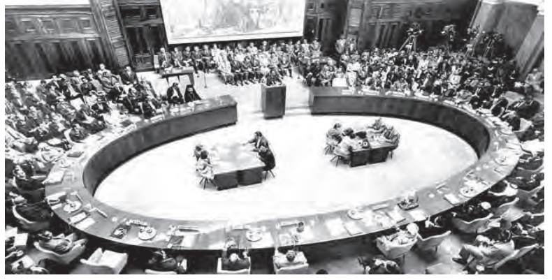
अलिप्ततावादी राष्ट्रांची पहिली शिखर परिषद, बेलग्रेड १९६१

अलिप्ततावाद हे भारतीय परराष्ट्र धोरणाचे एक महत्त्वाचे वैशिष्ट्य आहे. अलिप्ततावादाचा शब्दशः अर्थ ‘कोणत्याही लष्करी कराराचा भाग होण्यास नकार’ असा आहे. भारताने दोन्ही महासत्तांच्या शीतयुद्ध राजकारणाला असा प्रतिसाद दिला. युरोप, आशिया आणि जगातील इतर भागांतील देशांशी लष्करी करार करून अमेरिका आणि सोव्हिएट रशिया आपापले प्रभावक्षेत्र विस्तारण्याचा प्रयत्न करत होते.