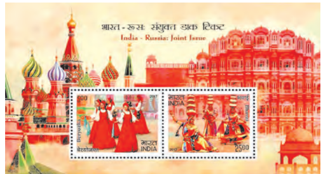
भारत-रशिया संयुक्त पोस्टाचे तिकीट

सोव्हिएट रशिया/रशिया : सोव्हिएट रशियाबरोबरील संबंध हे शीतयुद्धकाळातील भारताचे सर्वाधिक टिकाऊ संबंध होते. भारताच्या सार्वजनिक क्षेत्रातील अवजड उद्योगांसाठी सोव्हिएट रशियाने तंत्रज्ञान आणि कमी व्याजदराचे कर्ज अशी मदत देऊ केली. भारताच्या संरक्षण दलांना महत्त्वाची शस्त्रास्त्रे पुरवली, तसेच यांपैकी काही शस्त्रास्त्रांचे भारतात उत्पादन करण्याचे करारही केले. या दोन देशांतील संबंधांमध्ये १९७१ चा भारत-सोव्हिएट मैत्री करार हा एक महत्त्वाचा टप्पा होता.