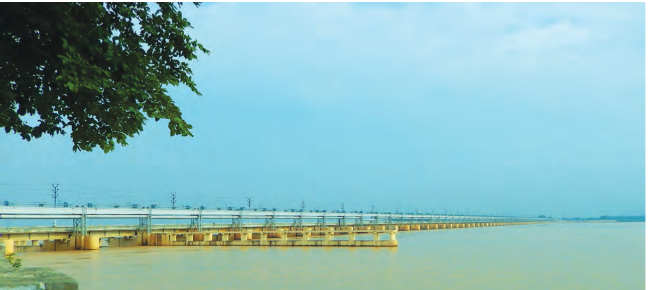
फराक्का बंधारा : १९९६ साली फराक्का येथील गंगा नदीच्या पाण्याच्या वाटपाबाबत भारत आणि बांगलादेश यांच्यामध्ये करार झाला.

१९७१ मध्ये बांगलादेशाला स्वातंत्र्य मिळण्यात भारताने केलेला हस्तक्षेप निर्णायक ठरला. या नव्या देशाशी भारताचे संबंध सुरुवातीला अगदी चांगले होते. मात्र, बांगलादेशाचे पहिले प्रधानमंत्री शेख मुजीब उर-रहमान यांच्या हत्येनंतर ते बिघडत गेले. भू-सीमा आणि सागरी सीमा यांवरील विवाद, तीस्ता नदीच्या पाण्याच्या वाटपावरील विवाद या दोन देशांच्या संबंधातील काही समस्या होत्या, परंतु गेल्या पाच वर्षांहून अधिक काळ या दोन देशातील संबंध मैत्रीचे राहिले आहेत. सीमापार दहशतवाद आणि अंतर्गत विद्रोह या दोन्ही देशांच्या सामाईक समस्या आहेत. अलीकडेच भारत आणि बांगलादेशाने सागरी सीमेवरील आणि land enclave विवाद यशस्वीपणे सोडवला आहे.