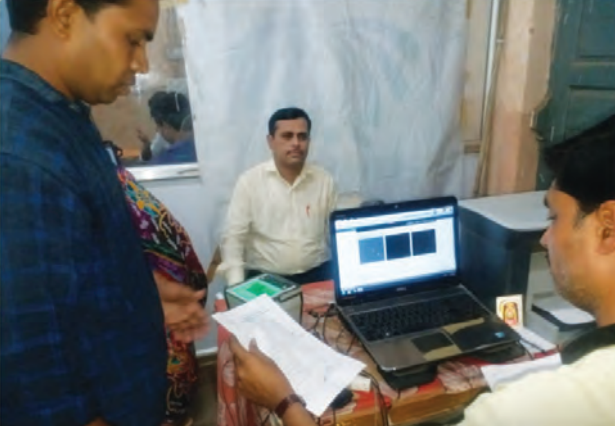
भारतातील प्रशासकीय सुधारणा : जिल्हाधिकारी कार्यालयात आधार कार्डाची दुरुस्ती

भारतातील प्रशासकीय सुधारणा : भारतात सुशासन निर्माण करण्यासाठी तयार केलेल्या विशेष कार्यक्रमांची चर्चा करूयात.