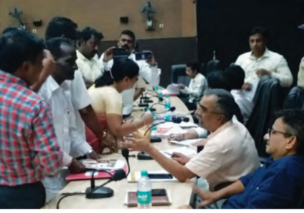
भारतातील प्रशासकीय सुधारणा : जिल्हाधिकारी कार्यालयात आयोजित जनता दरबारात नागरिकांशी संवाद.