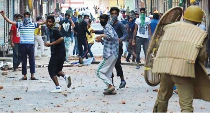
काश्मीरमधील दगडफेक करणारी मुले

शासनाने लोकसभेत दिलेली माहिती : पाकव्याप्त काश्मीर किंवा पाकिस्तानात दहशतवाद्यांनी निर्माण केलेल्या तयारीचा फायदा घेऊन घुसखोर जम्मू-काश्मीरसहित भारतात दहशतवादी हल्ले करतात.