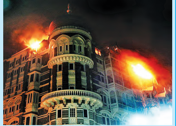
मुंबई येथील दहशतवादी हल्ले : जुलै २००६, नोव्हेंबर २००८