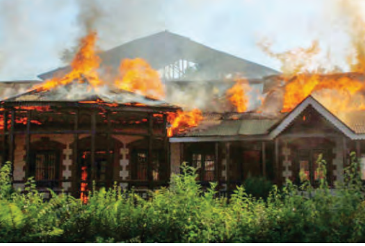
काश्मीरमधील शाळांची जाळपोळ