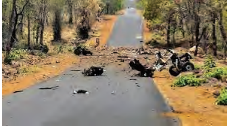
नक्षलवादी हल्ला, गडचिरोली

२००४ साली People's War (PW) ही आंध्रप्रदेशातील संघटना आणि भारतीय माओवादी केंद्र (MCCI) या बिहार आणि परिसरात वावर असणाऱ्या संघटना एकत्र आल्या आणि त्यांनी CPI (Maoist) माओवादी पक्ष स्थापन केला. हा पक्ष डावा उग्रवादी पक्ष आहे. या पक्षाचा समावेश बेकायदा कारवाई प्रतिबंध कायदा, १९६७ च्या तरतुदीनुसार (Unlawful Activities (Prevention) Act 1967) दहशतवादी संघटनेत केला आहे. CPI च्या माओवादी विचारसरणीचा वापर सशस्त्र बंडाने शासन उलथवून टाकण्यासाठी केला जातो.