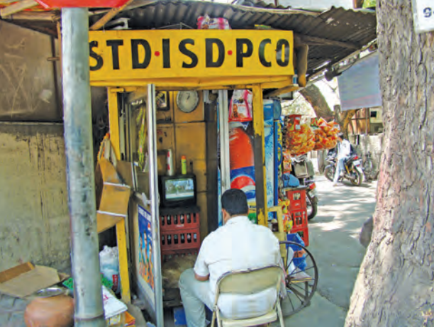
STD ISD टेलिफोन बुथ

तंत्रज्ञानातील सर्वांत महत्त्वाची क्रांती ही इंटरनेटची क्रांती होय. जगात कोणाशीही कुठेही तात्काळ संपर्क साधण्याची सोय निर्माण झाली आहे. विचार, संस्कृती आणि माहितीचा जगात प्रसार कोठेही करणे यामुळे शक्य झाले आहे. इंटरनेटच्या 'सर्च इंजिन' च्या माध्यमातून आपल्याला माहिती गोळा करता येते. तसेच 'ट्विटर', 'स्काईप', 'फेसबुक', 'इन्स्टाग्राम', 'व्हॉट्स अॅप'च्या माध्यमातून सोशल 'नेटवर्किंग' ची सोय उपलब्ध झाली आहे.