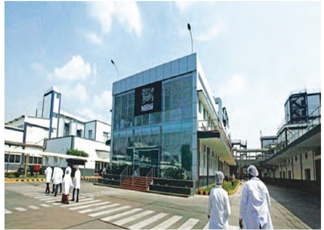
नेस्ले उद्योग, भारत