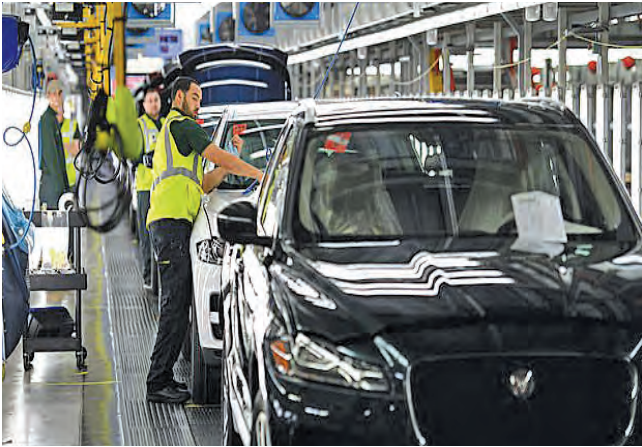
टाटा जॅम्बर लॉड रोव्हरचा कारखाना, युनाइटेड किंग्डम