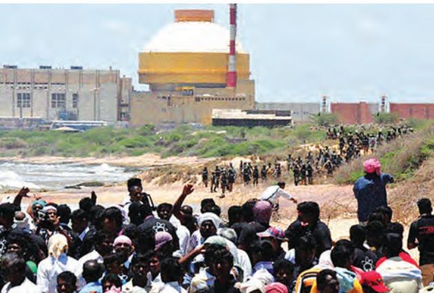
कुडनकुलम आण्विक प्रकल्पाविरोधी आंदोलन

• जैतापूर आणि कुडनकुलम येथील आण्विक प्रकल्पांना विरोध केला जात आहे. या प्रकल्पांना योग्य त्या परवानग्या मिळूनही काही राजकीय पक्ष आणि NGOs त्यांना विरोध करत आहेत.