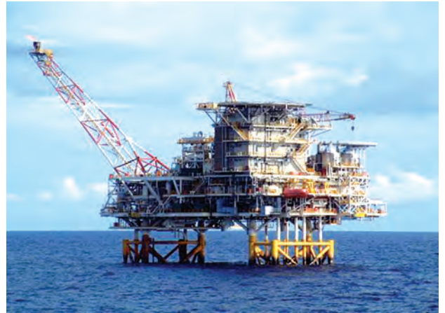
ONGC विदेश लि., व्हिएतनाम