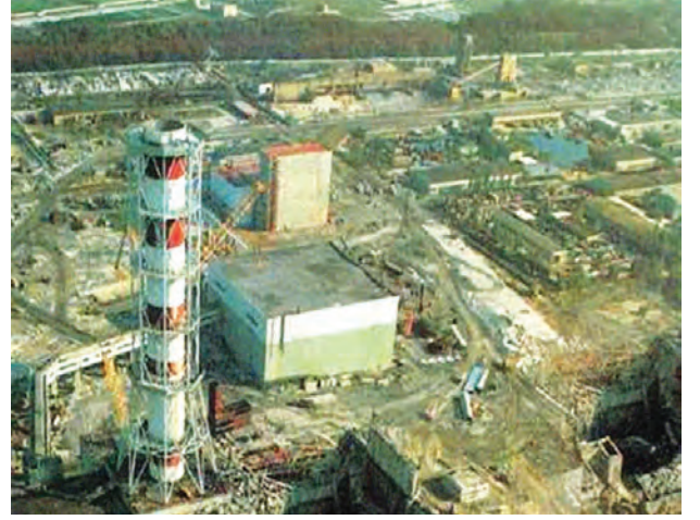
अपघातानंतरचा चेर्नोबिल आण्विक प्रकल्प