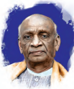
सरदार वल्लभभाई पटेल

भारत स्वतंत्र झाला तेव्हा भारतात सहाशेपेक्षा अधिक लहान-मोठी संस्थाने होती. स्वतंत्र भारतापुढील हा मोठा प्रश्न होता. असहकार आंदोलनाच्या प्रभावामुळे संस्थानांमध्ये राजकीय जागृतीला सुरुवात झाली. संस्थानांच्या विलीनीकरणाचा प्रश्न सोडवण्यासाठी सरदार