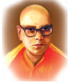
स्वामी रामानंद तीर्थ

हैदराबाद मुक्तिसंग्राम : हैदराबाद हे भारतातील सर्वात मोठे संस्थान होते. त्यामध्ये तेलुगु, कन्नड, मराठी भाषक प्रदेश होते. तेथील सत्ताधीश निजामाने प्रजेच्या नागरी व राजकीय हक्कांचा संकोच केला. आपले हक्क मिळवण्यासाठी संस्थानातील जनतेने तेलंगण भागात आंध्र परिषद, मराठवाडा भागात 'महाराष्ट्र परिषद' व कर्नाटक भागात 'कर्नाटक परिषद' या संस्था स्थापन केल्या.