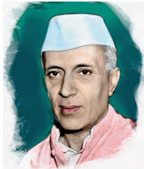
पंडित जवाहरलाल नेहरू

८ ऑगस्ट रोजी पंडित जवाहरलाल नेहरूंनी या अधिवेशनात मांडलेला ‘छोडो भारत’ ठराव प्रचंड बहुमताने मंजूर झाला. ब्रिटिशांनी तत्काळ भारत सोडावा अशी मागणी करण्यात आली. तसेच