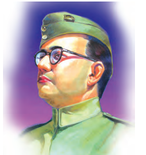
नेताजी सुभाषचंद्र बोस

१९३९ साली जर्मनीचा नेता हिटलर याने युरोपात दुसऱ्या महायुद्धाची ठिणगी पाडली. ब्रिटिश सरकारने भारत इंग्लंडच्या बाजूने युद्धात उतरत असल्याचा निर्णय परस्पर घेतला. या निर्णयाला