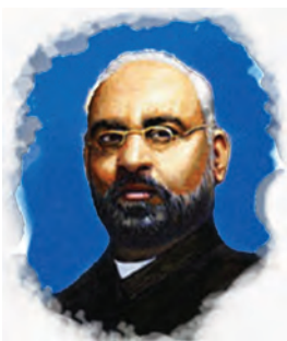
श्यामजी कृष्ण वर्मा

क्रांतिकारक चंद्रशेखर आझाद, भगतसिंग, राजगुरू, सुखदेव इत्यादी तरुण क्रांतिकारक धर्मनिरपेक्ष विचारसरणीचे