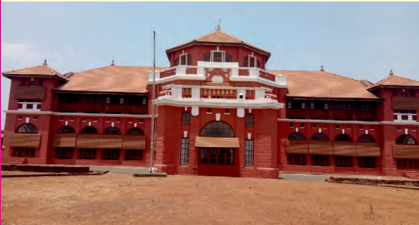
थिबा राजाचा राजवाडा-रत्नागिरी

योगायोगाची गोष्ट म्हणजे पुढे याच रत्नागिरी जिल्ह्यात जन्मलेल्या लोकमान्य टिळकांना इंग्रजांनी राष्ट्रीय चळवळीपासून दूर ठेवण्यासाठी म्यानमार या देशातील मंडालेच्या कारागृहात सहा वर्षे ठेवले होते. येथेच टिळकांनी 'गीतारहस्य' हा ग्रंथ रचला. पुढे नेताजी सुभाषचंद्र बोस यांना सुद्धा इंग्रज सरकारने मंडालेच्या तुरूंगात ठेवले होते.