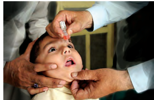
दो बूँद जिंदगी के

पोलिओ निर्मूलन : बदलत्या भारताचे प्रतिबिंब आरोग्याच्या क्षेत्रातही उमटले. १९९५ मध्ये भारत सरकारच्या आरोग्य विभागातर्फे 'पल्स पोलिओ' लसीकरणाची मोहीम सुरू झाली. जागतिक आरोग्य संघटना (WHO), युनिसेफ, रोटरी इंटरनॅशनल आणि भारत सरकार यांच्या संयुक्त विद्यमाने ही मोहीम राबवण्यात आली. ही मोहीम पोलिओ रोगाचे उच्चाटन करण्यासाठी होती. पाच वर्षे वयापर्यंतचे एकही बालक-