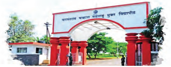
यशवंतराव चव्हाण महाराष्ट्र मुक्त विद्यापीठ

(६) शैक्षणिक घटक : शिक्षणाबाबतचे दुर्लक्ष, जागरूकतेची कमतरता आणि अनास्था हे परिवर्तनात अडथळे निर्माण करतात. विविध साधनांद्वारे शिक्षण-औपचारिक शिक्षण, सहज शिक्षण, अनौपचारिक शिक्षण आणि खुले किंवा दूरशिक्षण अशा शिक्षणाच्या संधी आज उपलब्ध आहेत.