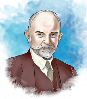
जॉर्ज हर्बर्ट मीड

मानवी वर्तन आणि कौशल्ये ही शिकावी आणि शिकवावी लागतात. ही शिकण्याची प्रक्रिया जिला सामाजीकरण म्हटले जाते. ती व्यक्तीचा एक व्यक्तिगत स्व ते सामाजिक स्व हा प्रवास घडवून आणते. सामाजीकरणाच्या प्रक्रियेतून व्यक्ती वर्तनाचे नियम शिकून समाजाची एक जबाबदार घटक बनते.