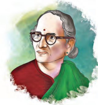
डॉ. इरावती कर्वे

इरावती कर्वे यांचा जन्म १५ डिसेंबर १९०५ रोजी म्यानमारमधील म्यांजान येथे झाला. नामवंत समाज सुधारक महर्षी धोंडो केशव कर्वे यांच्या त्या स्नुषा होत्या.