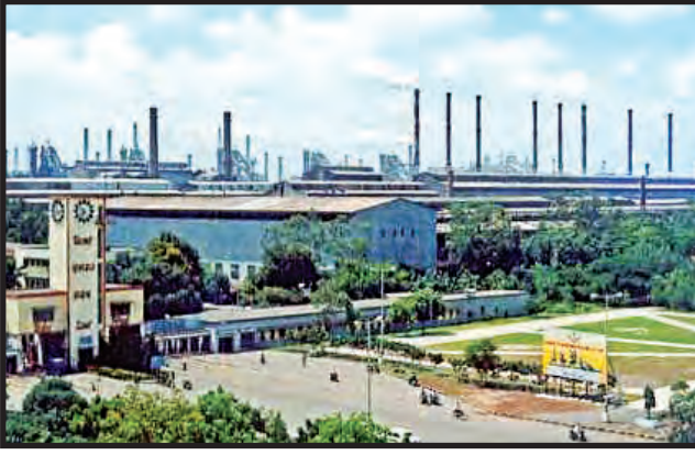
भिलाई पोलाद प्रकल्प

(ii) उत्पादनाभिमुख - विकास प्रशासनाचे उद्दिष्ट हे निष्पत्ती आणि परिणाम साध्य करणे आहे व त्यासाठी कामाचे मूल्यमापन करायचे नियम तयार केले आहेत. हे नियम साधारणतः संख्यात्मक स्वरूपाचे असतात. जर विकास प्रशासनाचे उद्दिष्ट बदल घडवणे हे असेल तर तो बदल घडवण्यासाठी काही लक्ष्य (ध्येय) ठरवणे आवश्यक आहे. यामुळे प्रशासकीय विभाग अपेक्षित ध्येय गाठू शकतात. या ध्येयावर भर दिल्यास प्रशासन अपेक्षित बदल साध्य करू शकतात. उदा., जेव्हा शासन ठरवते की अर्थव्यवस्था वाढीचा दर प्रतिवर्षी ८ ते १०% असावा, तेव्हा वाजवी आणि साध्य करता येण्याजोगी उद्दिष्टे सरकार ध्येय म्हणून समोर ठेवते.