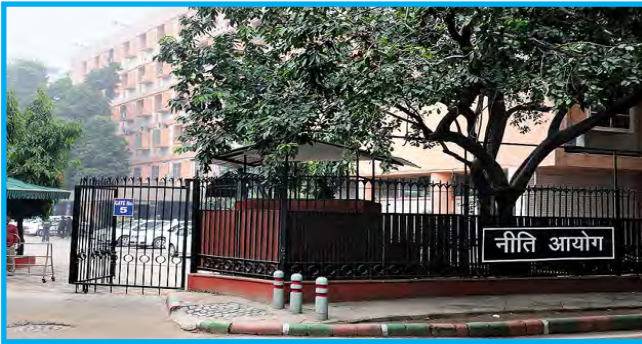
नीति आयोग - कार्यालय

१९९० च्या दशकात भारताने उदारीकरणाचे नवे आर्थिक धोरण स्वीकारले. या नव्या व्यवस्थेत नियोजनाचा दृष्टिकोन बदलण्याची आवश्यकता होती. २०१४ साली नियोजन आयोगाच्या जागी 'नीति आयोगा'ची स्थापना करण्यात आली. या आयोगाच्या स्थापनेद्वारे भारताने योजनांच्या केंद्रीकरणाकडून योजनांच्या विकेंद्रीकरणाकडे वाटचाल सुरू केली. तळागाळापासून, गावांतून, गटांतून, जिल्ह्यांतून योजना करून, राज्यपातळीवर एकसंध योजना तयार करण्याचा मानस नीति आयोगाचा आहे. राज्यपातळीवरील योजनांचा राष्ट्रीय योजनेमध्ये विचार केला जाईल आणि याद्वारे संपूर्ण देशाचा विकास साधला जाईल.