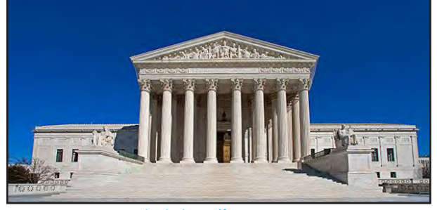
अमेरिकेचे सर्वोच्च न्यायालय

न्यायालयीन पुनर्विलोकनाची सुरुवात १८०३ मध्ये अमेरिकेत, मारबरी विरुद्ध मॅडीसन या खटल्यात झाली. या खटल्यात अमेरिकेतील सर्वोच्च न्यायालयाने प्रथमच काँग्रेसने केलेला कायदा घटनाबाह्य म्हणून घोषित केला. खरे पाहता, अमेरिकन संविधानात न्यायालयीन पुनर्विलोकनाच्या अधिकाराचा स्पष्टपणे उल्लेख केलेला नाही. परंतु तो सूचित (implied)