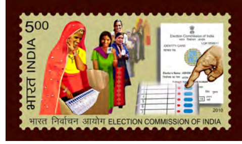
भारत निर्वाचन आयोग - पोस्टाचे तिकीट