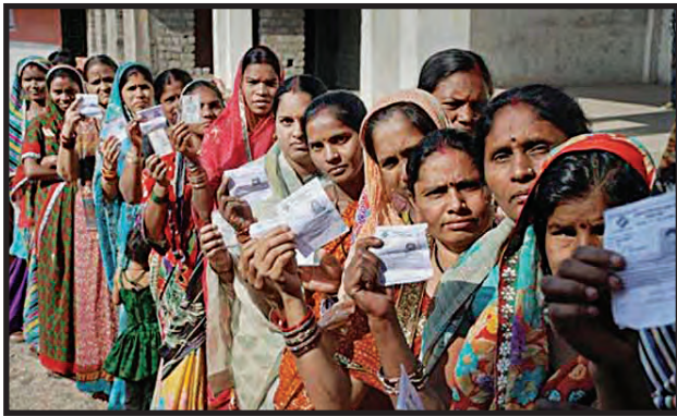
भारतातील महिला मतदार