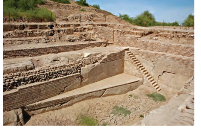
धोलावीरा येथील पाण्याचा तलाव.