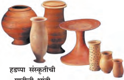
हडप्पा संस्कृतीची मातीची भांडी

मोहेंजोदडो : राखालदास बॅनर्जी यांनी इसवी सन १९२१-२२ मध्ये मोहेंजोदडो येथे उत्खनन सुरू केले. या उत्खननात सापडलेल्या मुद्रा आणि इतर पुरावस्तू यांच्यामधील साधर्म्यामुळे मेसोपोटेमियातील प्राचीन