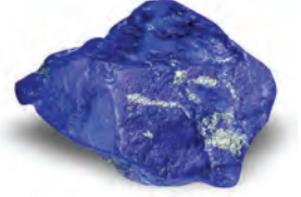
लाजवर्दी/ इंद्रनील दगड

हडप्पापूर्व काळातील सर्वच गाव-वसाहतींचे रूपांतर मोठ्या किंवा छोट्या नगरांमध्ये झाले नाही. काही गाव-वसाहतींमध्ये फारसे बदल घडले नाहीत. हडप्पा संस्कृतीच्या प्रमुख नागरी केंद्रांच्या गरजांची पूर्ती करणारी छोटी नगरे, लहानमोठ्या आकाराच्या गाव-वसाहती आणि निमभटक्या लोकांच्या हंगामी वस्त्या यांचे जाळे अस्तित्वात होते. त्यांमध्ये दुर्गम प्रदेशातील गाव-वसाहतींचाही समावेश होता. त्याचे उत्तम उदाहरण म्हणजे अफगाणिस्तानच्या बदकशान प्रांतातील 'शोर्तुगाय' ही हडप्पा संस्कृतीची वसाहत. तिथे लाजवर्दी/इंद्रनील दगडाच्या खाणी आहेत. या