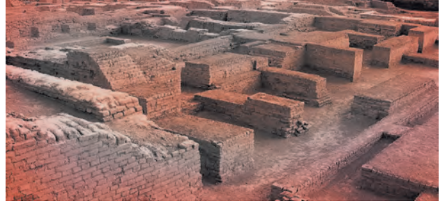
मोहेंजोदडोमधील अनेक दालने असलेले एक घर

मोहेंजोदडो येथील अवशेषांची हडप्पा येथील अवशेषांप्रमाणे नासधूस झालेली नव्हती. त्यामुळे तेथील उत्खननात उजेडात आलेली घरे, मोठ्या इमारती, रस्ते इत्यादींच्या अवशेषांच्या आधारे त्या नगराची भव्यता स्पष्ट झाली. हडप्पा संस्कृतीच्या नगररचनेचे उत्कृष्ट नियोजन आणि नगराचे व्यवस्थापन यांचा पुरावा प्राप्त झाला. मोहेंजोदडोच्या निर्मितीमधील पूर्वनियोजनाची