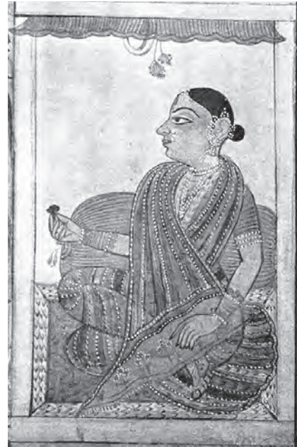
लघुचित्र - मराठी चित्रकला

थोरले बाजीराव, नानासाहेब पेशवे, पिलाजी जाधवराव यांची उत्कृष्ट व्यक्तिचित्रे उपलब्ध आहेत. चित्रकाम बहुधा वाड्यांच्या दर्शनी भागांवर तसेच दिवाणखान्याच्या व शयनगृहांच्या भिंतीवर आढळून येते. देवालयात मंडपाच्या भिंती, ओवऱ्या, शिखरे, गाभाऱ्याच्या भिंती आणि छत ही सुद्धा चित्रकामाने सुशोभित केलेली दिसतात. वाठारचा नाईक निंबाळकरांचा वाडा, मेणवलीचा नाना फडणवीसांचा वाडा, चांदवडचा रंगमहाल, मोरगावचे मयूरेश्वर मंदिर, पांडेश्वरचे शिवमंदिर, बेनवडीचा मठ अशा काही ठिकाणी अद्यापही अठराव्या शतकातील भित्तिचित्रे आहेत. या भित्तिचित्रांचे विषय मुख्यतः पौराणिक आहेत. त्यांत रामायण, महाभारत आणि पुराणे यांतील प्रसंग आहेत. दशावतार आणि कृष्णलीलांची चित्रे सर्वत्र आढळतात. तत्कालीन सामाजिक जीवनातील प्रसंगही लोकप्रिय होते. राजसभा, राजपुरुषांची भेट, मिरवणुकी यांचा यात समावेश होतो.