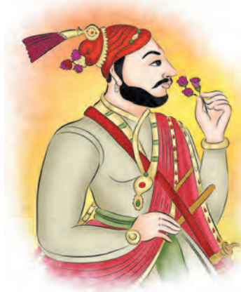
छत्रपती संभाजी महाराज

छत्रपती शिवाजी महाराजांच्या निधनानंतर संभाजी महाराजांनी स्वराज्य सांभाळले. त्यांचा मुघल बादशाह औरंगजेब याच्याशी सतत संघर्ष सुरू होता. याच काळात सत्तासंघर्षाच्या कारणास्तव औरंगजेबाचा मुलगा अकबर