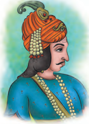
पहिला बाजीराव पेशवा

बाळाजी विश्वनाथांच्या नंतर पहिला बाजीराव यांना पेशवे पदावर नियुक्त केले गेले. त्यांच्या कारकिर्दीत मराठी साम्राज्याचा विस्तार माळवा, राजस्थान आणि बुंदेलखंडामध्ये झाला. त्यांनी निजामाला नामोहरम केले. पहिला बाजीराव यांच्यानंतर बाळाजी बाजीराव उर्फ