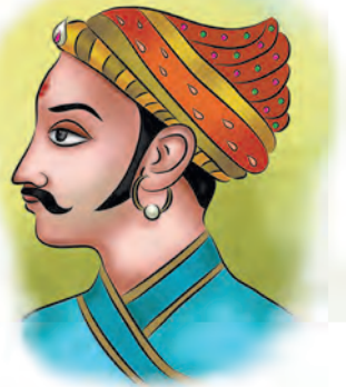
छत्रपती शाहू महाराज

त्यासाठी मुघलांच्या कैदेत असलेल्या शाहू महाराजांची त्यांनी सुटका इ.स.१७०७ मध्ये केली. या सुटकेनंतर महाराणी ताराबाई आणि शाहू यांच्यात युद्ध झाले. त्यात शाहू महाराजांचा विजय झाला. त्या