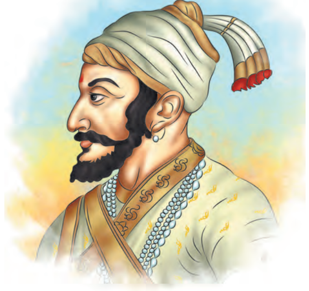
छत्रपती शिवाजी महाराज

स्वराज्याची संकल्पना शहाजीराजे भोसलेंनी मांडली व तिची पूर्तता त्यांचे पुत्र शिवाजी महाराज यांनी केली. शिवरायांनी स्वराज्य स्थापनेची सुरुवात मावळ भागात केली. त्यांच्या अत्यंत पराक्रमी व कुशल नेतृत्वाबरोबरने