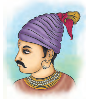
छत्रपती राजाराम महाराज

संघर्षाची जबाबदारी रामचंद्रपंत अमात्य, शंकराजी नारायण सचिव, संताजी घोरपडे व धनाजी जाधव यांच्यावर सोपवली होती. संताजी व धनाजी यांच्या गनिमी काव्यामुळे मुघलांना आपल्या प्रचंड