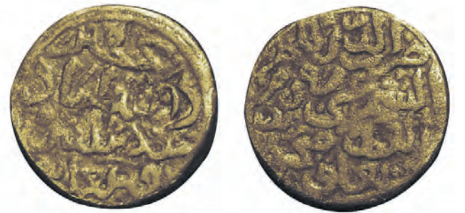
मुहम्मद बिन तुघलकाची नाणी

सुलतानशाहीच्या काळात चलन व्यवस्थेत मूलगामी बदल घडून आले. नाण्यांवर आता देवी-देवतांच्या प्रतिमेऐवजी खलिफांची व सुलतानांची नावे कोरली जाऊ लागली. नाणे पाडण्याचे वर्ष, टांकसाळीचे ठिकाण इत्यादी तपशीलही अरेबिक लिपीमध्ये कोरले जाऊ लागले. नाण्यांच्या वजनासाठी ‘तोळा’ हे प्रमाण प्रचलित झाले.