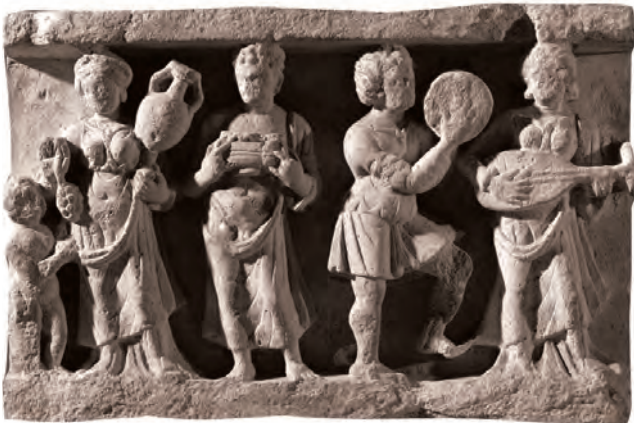
हड्डा येथील स्तूपावरचे शिल्प

प्राचीन काळी 'नगराहार' या नावाने ओळखले जाणारे, आधुनिक जलालाबादजवळचे 'हड्डा' हे स्थळ अफगाणिस्तानातील बौद्ध धर्माचे आणखी एक महत्त्वाचे केंद्र होते. तिथे अनेक स्तूप आणि विहार यांचे अवशेष आहेत. या स्तूपांच्या परिसरात मिळालेली शिल्पे गांधार शैलीचा अत्युत्कृष्ट नमुना आहेत. जागतिक वारशाचा दर्जा प्राप्त झालेले आणखी एक महत्त्वाचे ठिकाण 'तख्त-इ-बाही' या नावाने ओळखले जाते. ते गांधार प्रदेशातील पख्तुनख्वा प्रांतात आहे. हा भाग आता पाकिस्तानमध्ये समाविष्ट झालेला आहे.