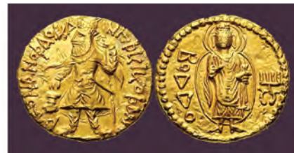
कनिष्काचे सोन्याचे नाणे

त्या मार्गाने कुशाण राजवटीत बौद्ध धर्माचा प्रसार