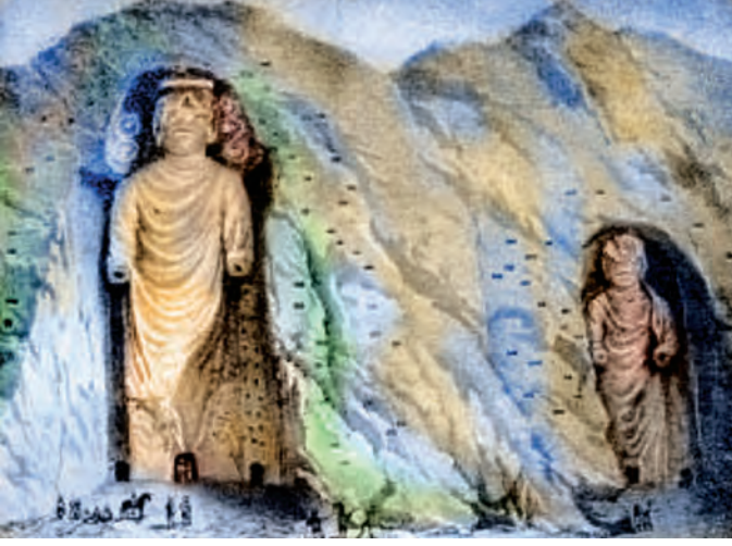
बामियान येथील बुद्धमूर्ती

दुर्मिळ बौद्ध हस्तलिखितांचे एक ग्रंथालयही होते. पुरातत्त्वीय संशोधकांना भूर्जपत्रे आणि तालपत्रे यांच्यावर लिहिलेली काही हस्तलिखिते बामियान येथील एका विहारात मिळाली आहेत.