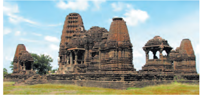
सिन्नर येथील गोंदेश्वर मंदिर

अभंगरचना केली. याच काळात अनेक मंदिरे बांधली गेली. या मंदिरांना हेमाडपंती मंदिरे असे म्हटले जाते. सिन्नर येथील गोंदेश्वर मंदिर, त्र्यंबकेश्वरजवळील अंजनेरी येथील मंदिर संकुल ही या काळात बांधल्या गेलेल्या मंदिरांची उत्तम उदाहरणे आहेत. हेमाडपंती मंदिरांचे महत्त्वाचे वैशिष्ट्य म्हणजे भिंतींचे दगड सांधण्यासाठी चुना वापरलेला नसतो. दगडांमध्येच एकमेकांत घट्ट बसतील अशा कातलेल्या खोबणी आणि कुसू यांच्या आधाराने भिंत उभारली जाते. या काळात नाशिकजवळील अंकाई आणि टंकाई अशा किल्ल्यांचेही बांधकाम झाले.