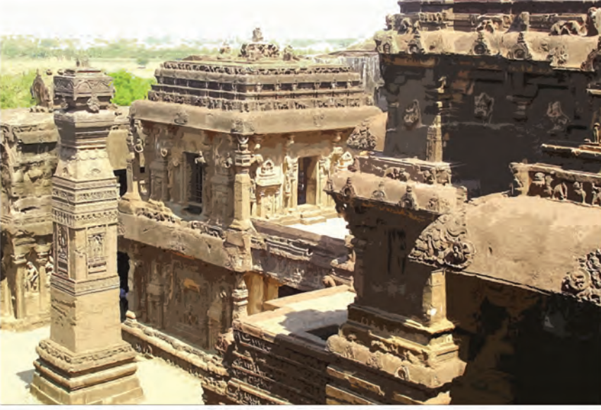
वेरूळ येथील कैलास मंदिर

शिलाहार : या घराण्याच्या तीन शाखा होत्या - दक्षिण कोकण, उत्तर कोकण आणि कोल्हापूरचे शिलाहार. ते स्वतःला 'तगरपुराधीश्वर' (तगर-तेर, जि. उस्मानाबाद) असे म्हणवून घेत. या तीनही शाखांचे राजे आद्यपुरुष म्हणून जीमूतवाहन याचा उल्लेख करताना दिसतात. शिलाहारांचा प्रभाव महाराष्ट्राबाहेर आढळून येत नाही. आधी राष्ट्रकूटांचे व नंतर चालुक्यांचे मांडलिकत्व पत्करून त्यांनी सुमारे तीनशे वर्षे राज्य टिकवून ठेवले.