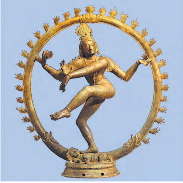
नटराजाची कांस्य मूर्ती

वाकाटकांच्या काळात दक्षिणेतील शिल्पकला व चित्रकला यांनी उत्कर्षबिंदू गाठलेला दिसतो. अजिंठा लेण्यातील क्र. १,२,१६,१७ आणि १९ ही लेणी या काळात निर्माण झाली. या लेण्यांच्या शिल्पकारांना शरीररचनेचे व निसर्गातील बारकाव्यांचे उत्तम ज्ञान होते, असे दिसते.