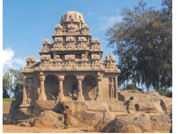
महाबलिपुरम येथील युधिष्ठिर रथमंदिर

कारकिर्दीत त्रिचिरापल्ली, चिंगलपूट, उत्तर व दक्षिण अर्काट जिल्ह्यांत अनेक मंदिरे बांधली गेली. याच्या कारकिर्दीत पल्लवांचे चालुक्य घराण्याशी युद्ध सुरू झाले. त्याचा पुत्र नरसिंहवर्मा याने चालुक्य सम्राट दुसरा पुलकेशी याचा पराभव केला. त्याच्या काळात महाबलिपुरम येथे अनेक मंदिरे निर्माण केली गेली. प्रसिद्ध चिनी प्रवासी युआन श्वांग काही काळ त्याच्या दरबारात होता. नरसिंहवर्माने याचे लेखन पल्लव सत्तेच्या इतिहासाचे महत्त्वाचे साधन आहे. पल्लवांचे राज्य नवव्या शतकापर्यंत अस्तित्वात होते. अपराजित हा शेवटचा पल्लव राजा होता. चोळ राजा आदित्य याने त्याचा पराभव करून पल्लवांचे राज्य नष्ट केले.