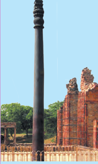
मेहरौली येथील लोहस्तंभ

गुप्त काळात धातूंचे मिश्रण व ओतकाम यामध्ये लक्षणीय प्रगती झाली होती. दिल्लीचा लोहस्तंभ त्याची साक्ष आहे. कित्येक शतके न गंजता राहिलेला हा लोहस्तंभ पाहता त्या काळी धातुविज्ञान अत्यंत प्रगत होते, हे लक्षात येते.