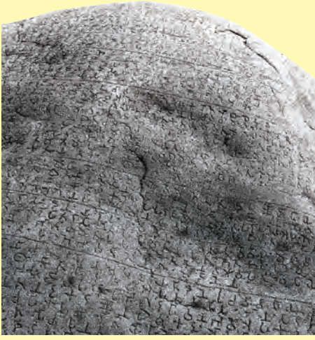
जुनागढ येथील शिलालेख

अधिक माहितीसाठी : शक राजा रुद्रदामन याची सत्ता, त्याचे सातवाहनांशी असलेले संबंध आणि त्याने सांस्कृतिक परिवर्तनाला दिलेला राजाश्रय यामुळे उल्लेखनीय ठरते. सौराष्ट्रातील जुनागढ येथील शिलालेख हा संस्कृतमधील महत्त्वाचा शिलालेख आहे. हा शिलालेख सम्राट अशोकाच्या लेखाखाली कोरलेला आहे. अशोकाचा लेख प्राकृतमध्ये तर रुद्रदामन याचा लेख संस्कृतमध्ये आहे. त्यावरून शक राजांनी संस्कृत भाषा स्वीकारली होती, असे दिसून येते. रुद्रदामनचा शिलालेख मुख्यतः मौर्यकालीन सुदर्शन तलावाच्या दुरुस्तीची नोंद करणारा आहे. सम्राट अशोकाच्या काळातील तलावाची डागडुजी रुद्रदामनने केली यावरून त्या तलावाचा दीर्घकाळ उपयोग होत होता, हे लक्षात येते. रुद्रदामनच्या प्रशस्तीमध्ये त्याच्या नर्मदा खोऱ्यातील विजयाची, सातवाहन राज्यावरील मोहिमांची आणि राजस्थानातील यौद्धेय गणराज्यावरील त्याच्या विजयाची स्तुती केलेली आहे.