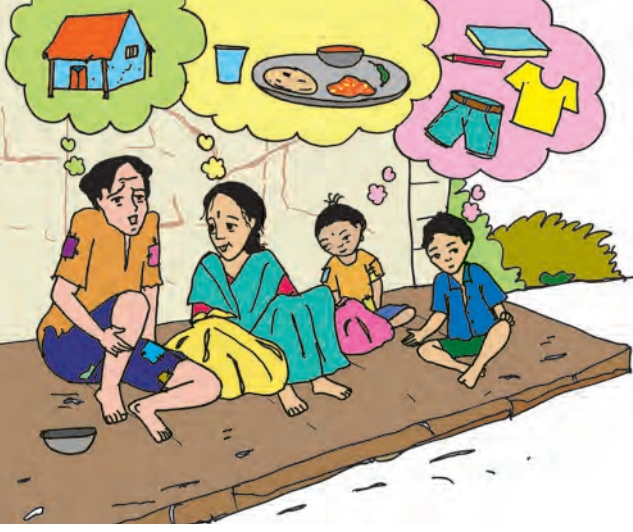
आकृती ८.१ दारिद्र्य