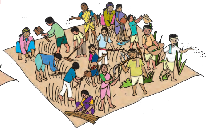
आ) सोळा कामगार = दहा क्विंटल ज्वारी