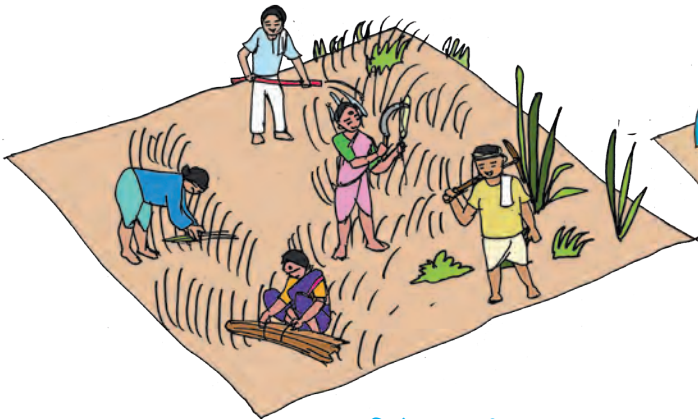
अ) पाच कामगार = दहा क्विंटल ज्वारी