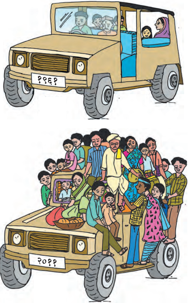
आकृती ६.३ लोकसंख्या विस्फोट