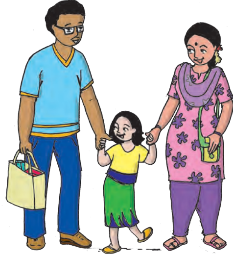
आकृती ६.५ : छोटे कुटुंब

क) भारतातील लोकसंख्या धोरण : भारतातील लोकसंख्येचे धोरण खालील कार्यक्रमांद्वारे राबविले गेले.