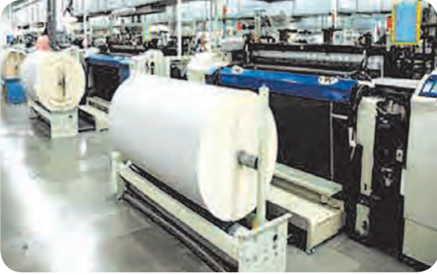
आकृती ४.३ : उद्योग

२०१६-१७ नुसार महाराष्ट्र हे आद्योगिक क्षेत्रात अग्रेसर आहे. महाराष्ट्राच्या तसेच देशाच्या आर्थिक विकासात राज्याच्या औद्योगिक क्षेत्राचा मोठा वाटा आहे. उद्योग क्षेत्रामध्ये शेती क्षेत्रातील अतिरिक्त कामगार सामावून घेण्याची क्षमता आहे. यामुळे बाजारांमध्ये विविधता, उच्च उत्पन्न व उच्च उत्पादकता निर्माण होते. भारताच्या निव्वळ मूल्य जमा वर्धित (NVA) उत्पादनात महाराष्ट्राचा वाटा सुमारे १८% आहे. प्रादेशिक व विदेशी गुंतवणूकदार महाराष्ट्रातील उद्योगात गुंतवणूक करण्यास प्राधान्य देतात.