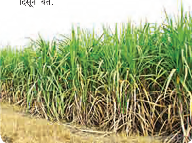
आकृती ४.२ : कृषी

अ) कृषी क्षेत्र : कृषी क्षेत्र व संलग्न क्षेत्र राज्याच्या आर्थिक विकासामध्ये प्रमुख भूमिका पार पाडतात. महाराष्ट्राच्या आर्थिक सर्वेक्षणानुसार कृषी व संलग्न क्षेत्रातील राज्याचे एकूण उत्पादनाचे मूल्यवर्धित प्रमाण २००१-२००२ मध्ये १५.३ टक्के इतके होते. या तुलनेत २०१६-१७ मध्ये हे प्रमाण १२.२ टक्के इतके कमी झाल्याचे दिसून येते.