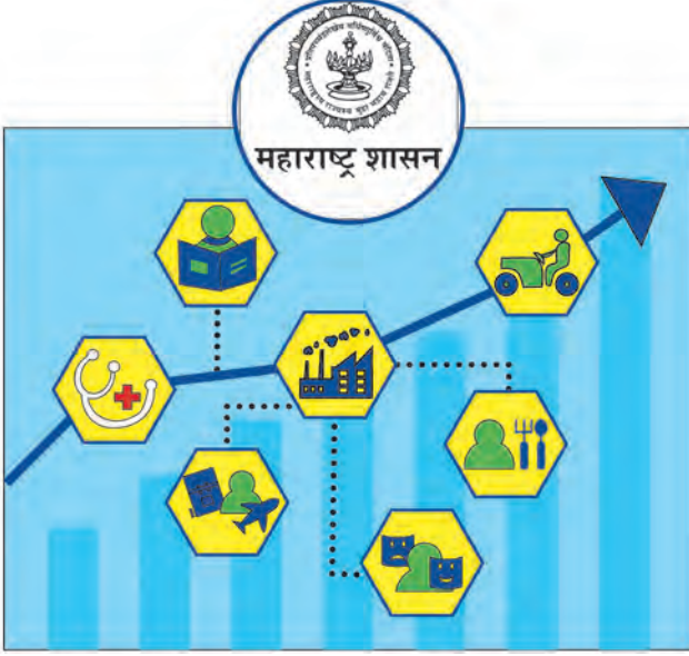
आकृती ४.१ : महाराष्ट्राची अर्थव्यवस्था

अ) कृषी क्षेत्र : कृषी क्षेत्र व संलग्न क्षेत्र राज्याच्या आर्थिक विकासामध्ये प्रमुख भूमिका पार पाडतात. महाराष्ट्राच्या आर्थिक सर्वेक्षणानुसार कृषी व संलग्न क्षेत्रातील राज्याचे एकूण उत्पादनाचे मूल्यवर्धित प्रमाण २००१-२००२ मध्ये १५.३ टक्के इतके होते. या तुलनेत २०१६-१७ मध्ये हे प्रमाण १२.२ टक्के इतके कमी झाल्याचे दिसून येते.