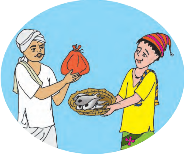
आकृती २.१ वस्तुविनिमय

मानव हा बुद्धिमान प्राणी आहे. पैशाचा शोध हा जगातील अनेक महत्त्वपूर्ण व मूलभूत शोधांपैकी एक आहे. क्राऊथर यांच्या मते ज्ञानाच्या प्रत्येक शाखेत काही मूलभूत संशोधन असते. उदा. विज्ञानात अग्नीचा शोध, यांत्रिक शास्त्रात चाकांचा शोध इत्यादी. पैशाचा शोध हा असाच एक महत्त्वपूर्ण शोध असून, त्याने मानवाच्या आर्थिक आयुष्यात क्रांतिकारी बदल घडवून आणला आहे. पैशांद्वारे विविध वस्तू व सेवांची खरेदी-विक्री करता येते. पैशामुळे गरजांचे समाधान होते. आधुनिक अर्थव्यवस्था पैशावर अवलंबून आहे. दैनंदिन व्यवहारात पैसा हा वस्तुविनिमयातील समस्या दूर करतो.