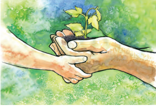
पर्यावरणाचे रक्षण : एका पिढीकडून दुसऱ्या पिढीकडे

वनस्पती व प्राणी यांच्या प्रजाती नष्ट होणे, मातीचा कस कमी होणे, पाण्याची टंचाई, पावसाचे प्रमाण कमी-जास्त होणे, तापमान वाढ, नद्या, तलाव आटणे, नद्या व समुद्राचे प्रदूषण, नवीन रोगांची निर्मिती, आम्लपर्जन्य, ओझोन थराचे विरळ होणे हे पर्यावरण न्हासाचे दृश्य परिणाम आहेत. यांपैकी काही परिणाम हे विशिष्ट राष्ट्रापुरते मर्यादित असले तरी त्यांच्या दीर्घकालीन परिणामांमुळे त्या प्रश्नांना जागतिक स्वरूप प्राप्त होते, तर काही प्रश्न मुळातच जागतिक स्वरूपाचे असतात.