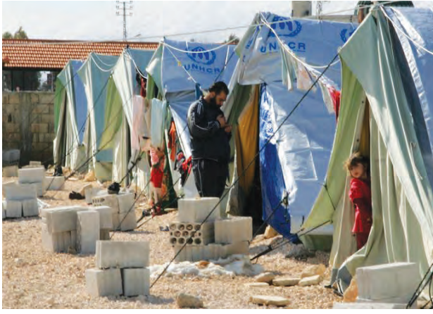
निर्वासितांना संयुक्त राष्ट्रांचे साहाय्य

दुसऱ्या महायुद्धापूर्वी जर्मनीमध्ये ज्यू लोकांचा छळ झाला, त्यांचे नागरिकत्व व संपत्ती हिरावून घेतली गेली. त्यामुळे ज्यू लोक निर्वासित झाले. १९७१ मध्ये पूर्व पाकिस्तानातील जनतेचा राजकीय व धार्मिक छळ झाल्यामुळे तेथील लोक निर्वासित झाले आणि भारतात आश्रयाला आले. गेल्या काही वर्षांत इराक आणि सिरियामधील युद्धजन्य परिस्थितीमुळे तेथून मोठ्या प्रमाणावर लोक निर्वासित म्हणून बाहेर पडत आहेत. निर्वासितांची अशी अनेक उदाहरणे आपल्याला सांगता येतील.