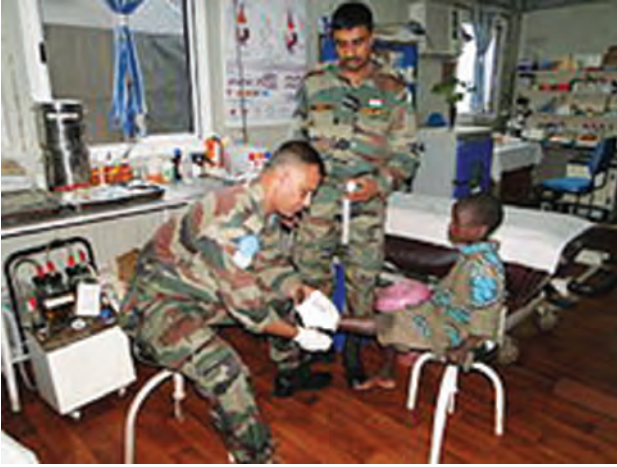
भारतीय शांती सैनिक

* संयुक्त राष्ट्रांच्या शांतिसेनांसाठी सैन्य पाठवण्यामध्ये कोणती राष्ट्रे आघाडीवर आहेत, याची सूची तयार करा.