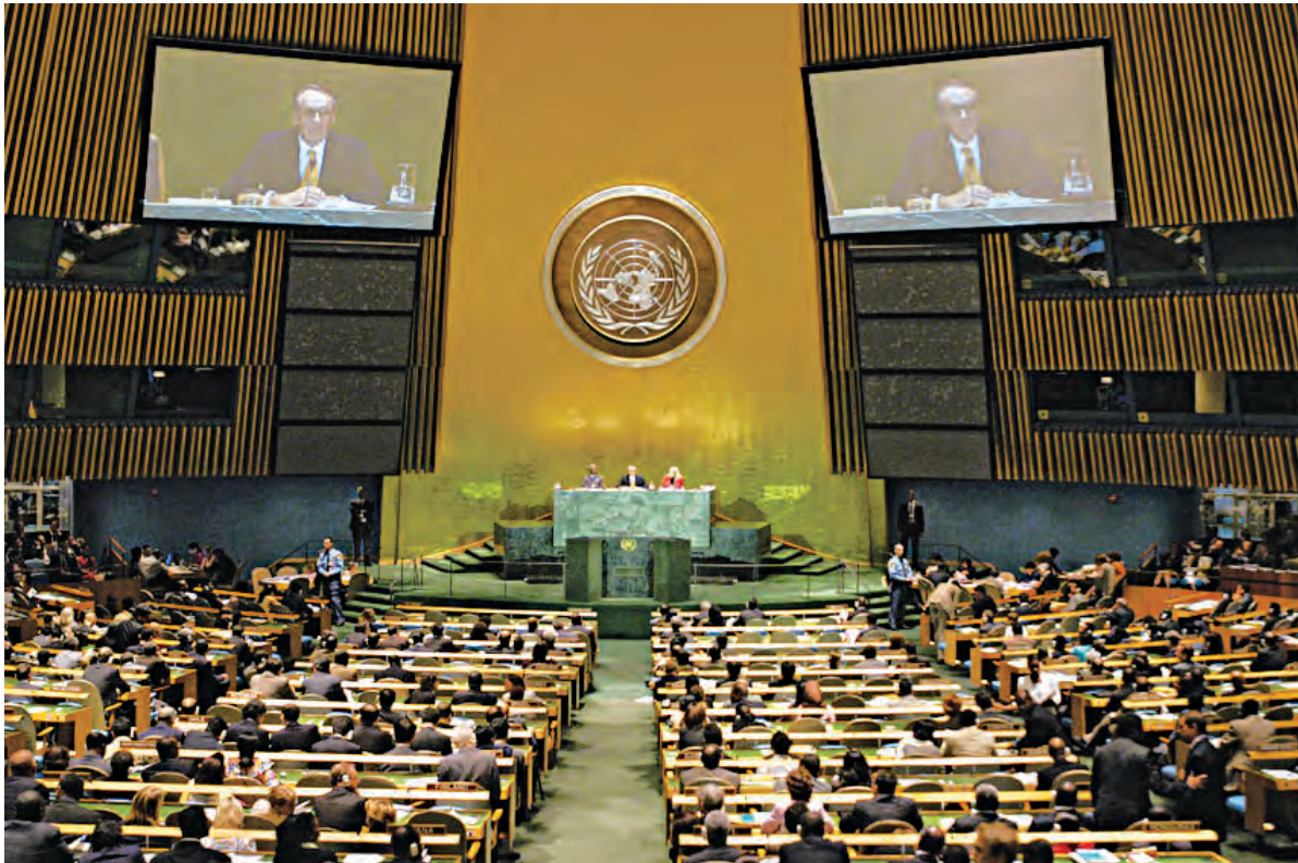
संयुक्त राष्ट्रे - आमसभा

(१) आमसभा (२) सुरक्षा परिषद (३) आर्थिक आणि सामाजिक परिषद (४) आंतरराष्ट्रीय न्यायालय (५) विश्वस्त मंडळ (६) सचिवालय.