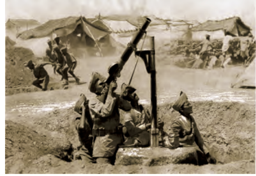
पहिल्या महायुद्धात सहभागी झालेले भारतीय सैनिक

पहिल्या महायुद्धानंतर शांतता प्रस्थापित करण्यासाठी राष्ट्रसंघ निर्माण झाला. परंतु राष्ट्रसंघाला युद्ध थोपवण्यात यश आले नाही. जर्मनी, इटली, स्पेन इत्यादी देशांमध्ये तर हुकूमशाही राजवटी अस्तित्वात आल्या. या सर्व घडामोडींची परिणती दुसऱ्या महायुद्धात झाली.