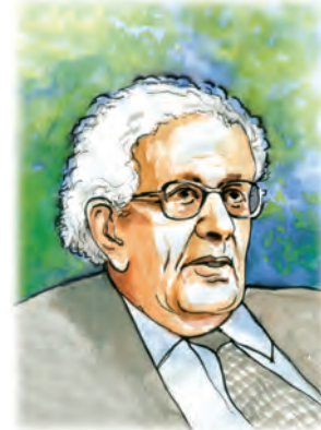
डॉ. होमी सेठना

पोखरण येथील पहिली अणुचाचणी : शांतता व स्वयंपूर्णतेसाठी अणुऊर्जेचा उपयोग या धोरणास अनुसरून भारताने १८ मे १९७४ रोजी राजस्थानमधील पोखरण येथे पहिली अणुचाचणी