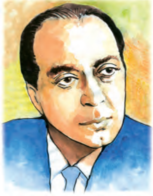
डॉ. होमी भाभा

भारतीय अणुऊर्जा आयोग : भारताचे प्रधानमंत्री पंडित जवाहरलाल नेहरू यांना वैज्ञानिक दृष्टिकोन