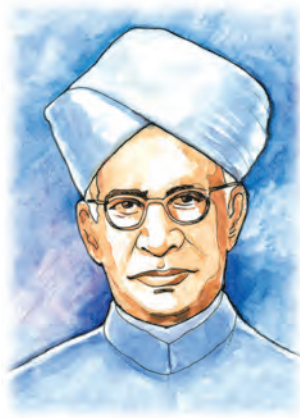
डॉ. सर्वपल्ली राधाकृष्णन

स्वातंत्र्योत्तर कालखंडातील शिक्षण : भारत