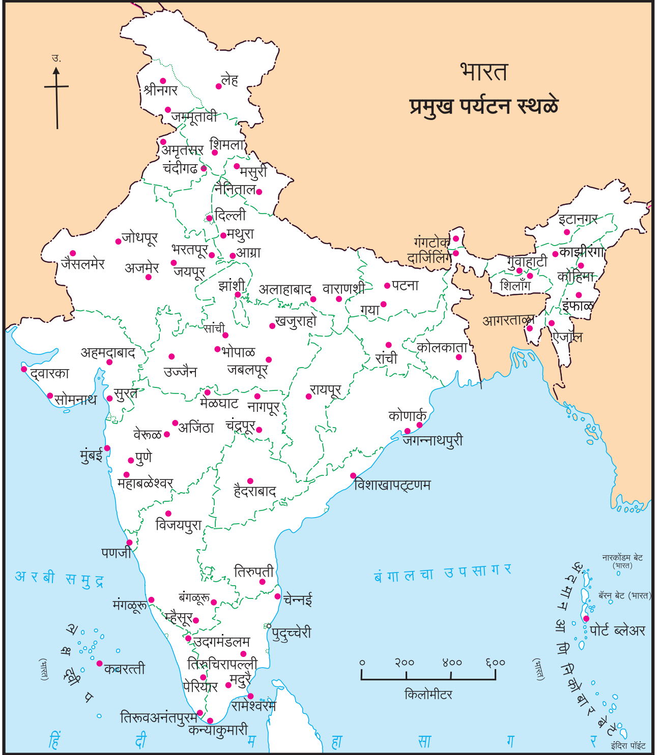
आकृती १२.१ : भारतातील प्रमुख पर्यटन स्थळे