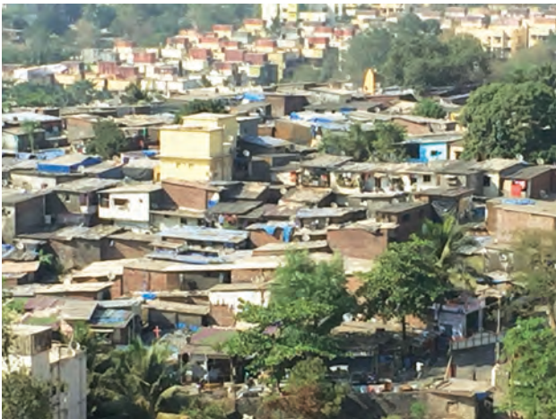
आकृती १०.२ : झोपडपट्टी

झोपडपट्टी : नागरीकरणामुळे शहरांमधील लोकसंख्या झपाट्याने वाढते. ज्या प्रमाणात लोकसंख्या वाढते, त्या प्रमाणात शहरामध्ये निवासव्यवस्था वाढत नाही. बहुतांशी स्थलांतरित हे आर्थिकदृष्ट्या दुर्बल असतात. त्यांना शहरातील निवासस्थाने परवडत नाहीत. स्थलांतरित होणारे बहुतेक लोक रोजगारानिमित्त शहरात येतात; परंतु सर्वांना योग्य रोजगार मिळतोच असे नाही, त्यामुळे अनेक लोकांचे उत्पन्न कमी असते. असे लोक शहरात उपलब्ध असलेल्या