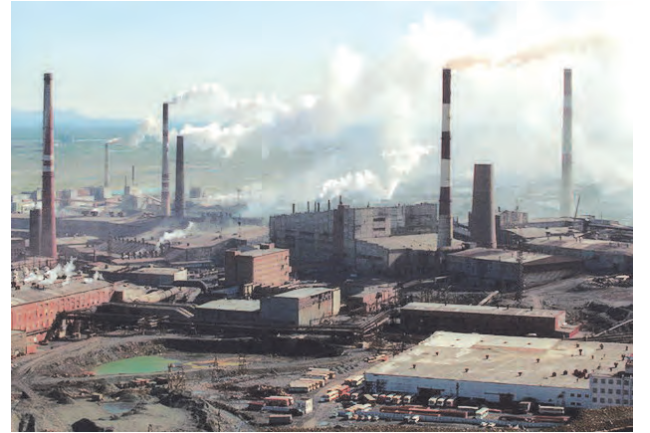
आकृती १०.१ : औद्योगिकीकरण

एखाद्या प्रदेशामध्ये उद्योगांचा विकास व केंद्रीकरण होणे हा नागरीकरणाला साहाय्यभूत ठरणारा घटक आहे. उद्योगधंद्यांच्या वाढीमुळे नोकरीच्या आशेने आजूबाजूच्या प्रदेशातील लोक या प्रदेशाकडे आकर्षित होतात, त्यामुळे नागरीकरणाची प्रक्रिया गतिमान होते. एकोणिसाव्या शतकादरम्यान मुंबई शहराची वाढ झपाट्याने झाली, कारण मुंबईमध्ये मोठ्या प्रमाणावर कापडगिरणी उद्योग सुरू झाला होता. त्यामुळे मूळची कोळ्यांची वस्ती असलेली अनेक गावे औद्योगिकीकरणामुळे व नागरीकरणामुळे मुंबई महानगराचा भाग झाली.