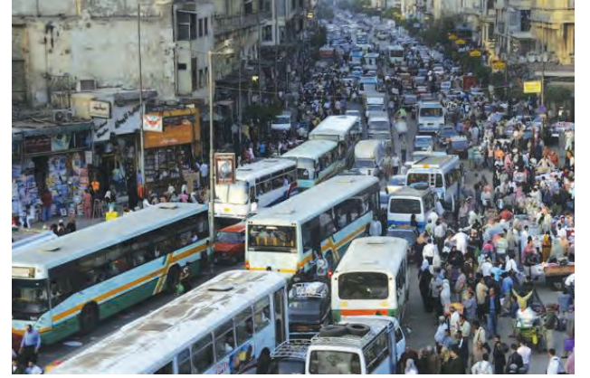
आकृती १०.३ : वाहतुकीची कोंडी

वाहतुकीची कोंडी : शहरांचा क्षेत्रीय विस्तार झाल्याने शहरांच्या बाह्यवर्ती भागात व उपनगरांत लोक निवास करतात. शहरांच्या केंद्रवर्ती भागात व्यवसाय, उद्योग, व्यापार, नोकरी, शिक्षण इत्यादींसाठी रोज उपनगरांतून लोकांची ये-जा सुरू असते. सार्वजनिक वाहतूक सेवा लोकसंख्येच्या प्रमाणात पुरेशा उपलब्ध नसल्यास खासगी वाहनांची गर्दी वाढते. परिणामी वाहतुकीची कोंडी होते व प्रवासात बराच वेळ जातो. आकृती १०.३ पहा.