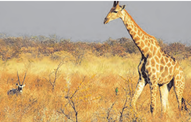
18.3 गवताळ प्रदेश

अ. गवताळ प्रदेशातील परिसंस्था (Grassland Ecosystem) : ज्या प्रदेशात पावसाचे प्रमाण मोठमोठी झाडे वाढविण्यासाठी पुरेसे नसते, त्या ठिकाणी गवताळ प्रदेश तयार होतात. या प्रकारच्या परिसंस्थामध्ये गवताची मोठ्या प्रमाणात वाढ होत असते. मोठा उन्हाळा आणि माफक पाऊस यामुळे खुरट्या वनस्पतींची वाढ होते. शेळी, मेंढी, जिराफ, झेब्रा, हत्ती, हरिण, चितळ, वाघ, सिंह इत्यादी प्राणी या प्रदेशात आढळतात. त्याचप्रमाणे विविध पक्षी, कीटक व सूक्ष्मजीवसुद्धा असतात.