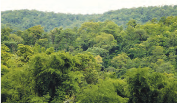
18.4 जंगल परिसंस्था

ही निसर्गनिर्मित परिसंस्था आहे. जंगलामध्ये विविध प्रकारचे प्राणी, वृक्ष, एकाच ठिकाणी असतात. अजैविक घटकांमध्ये जमिनीत व हवेत असणारे सेंद्रिय, असेंद्रिय घटक, हवामान, तापमान, पर्जन्यमान हे घटक वेगवेगळ्या प्रमाणात आढळतात.