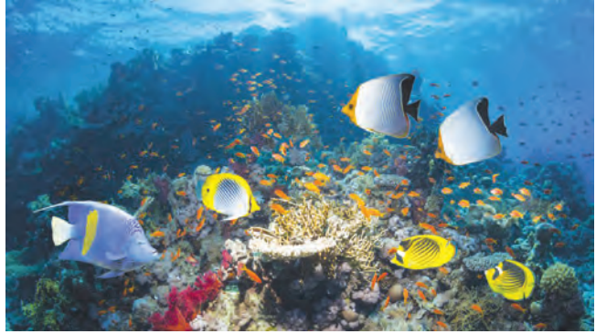
18.5 जलीय परिसंस्था

जलीय परिसंस्था (Aquatic Biomes) : पृथ्वीवर 71 % भूभाग पाण्याने व्यापला असून फक्त 29% भागावर जमीन आहे. त्यामुळे जलीय परिसंस्थांचा अभ्यास अत्यंत महत्त्वाचा ठरतो. नैसर्गिक परिसंस्थेत जलपरिसंस्था अभिक्षेत्रीय दृष्टीने जास्त व्यापक आहे. जलपरिसंस्थेमध्ये खालील प्रकार महत्त्वाचे मानले जातात. उदा. गोड्या पाण्यातील परिसंस्था, खाऱ्या पाण्यातील परिसंस्था, खाडी परिसंस्था.