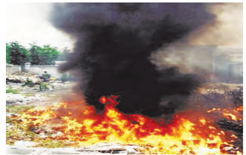
17.4 थर्मोकोल ज्वलन व त्यातून प्रदुषण