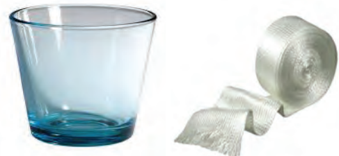
17.6 विविध प्रकारच्या काचेपासून तयार केलेल्या वस्तू

प्रयोगशाळेत वक्रनलिका तयार करण्याची कृती शिक्षकांच्या निरीक्षणाखाली करा.