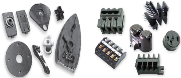
17.3 थर्मोसेटिंग प्लॅस्टिक