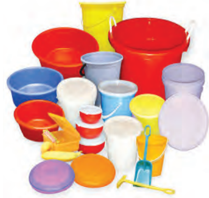
17.1 प्लॅस्टिकच्या वस्तू