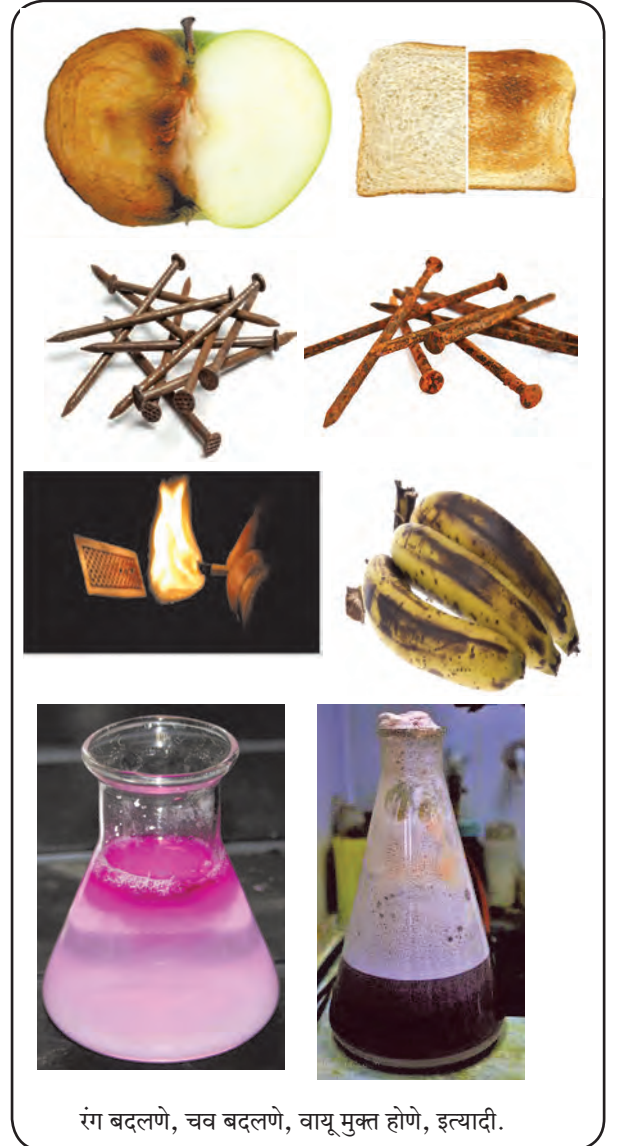
रंग बदलणे, चव बदलणे, वायू मुक्त होणे, इत्यादी.

वरील कृतीतील बदल घडून येत असताना जाणवण्याजोगी अनेक निरीक्षणे आढळतात. बुडबुड्यांच्या रूपात वायू मुक्त होताना दिसतो. हलकासा ध्वनी ऐकू येतो. खाण्याच्या सोड्याचे पांढरे स्थायूकण दिसेनासे होतात. मूळची आंबट चव कमी किंवा नाहीशी होते. त्यावरून ह्या बदलात वेगळ्या चवीचा नवीन पदार्थ तयार झाल्याचे समजते. वरील बदलाच्या शेवटी पदार्थाची चव वेगळी होती म्हणजे त्याचे संघटन वेगळे होते. याचा अर्थ असा, की वरील बदलात मूळ पदार्थाचे संघटन बदलून वेगळ्या गुणधर्माचा नवीन पदार्थ तयार झाला म्हणजेच लिंबूसोत खाण्याचा सोडा मिसळल्यावर होणारा बदल हा रासायनिक बदल आहे. काही वेळा रासायनिक बदल घडत असताना वेगवेगळी वैशिष्ट्यपूर्ण निरीक्षणे जाणवतात व त्यावरून रासायनिक बदल झाल्याचे ओळखता येते. त्यांपैकी काही निरीक्षणे तक्ता क्र 13.1 मध्ये दिली आहेत.