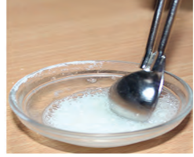
13.2 फसफसण्याची क्रिया होवून कार्बन डायऑक्साइडची निर्मिती

रासायनिक बदल व शाब्दिक समीकरण : रासायनिक बदल घडताना मूळच्या द्रव्याचे रासायनिक संघटन बदलून, वेगळे रासायनिक संघटन असलेले वेगळ्या गुणधर्माचे नवीन पदार्थ तयार होतात. रासायनिक संघटनातील बदल नेमकेपणाने माहित असल्यास रासायनिक बदलासाठी रासायनिक अभिक्रिया लिहिता येते. रासायनिक अभिक्रिया लिहिताना मूळच्या द्रव्यातील रासायनिक पदार्थाचे नाव व रासायनिक सूत्र, तसेच तयार झालेल्या नवीन पदार्थाचे नाव व रासायनिक सूत्र यांचा उपयोग करतात. उदाहरणार्थ, लिंबूसाठी खाण्याचा सोडा मिसळल्यास घडून येणारा रासायनिक बदल हा लिंबूसामधील सायट्रिक आम्लामध्ये होतो व तयार होणारा वायू कार्बन डायऑक्साइड असतो. या रासायनिक अभिक्रियेसाठी पुढीलप्रमाणे शाब्दिक समीकरण लिहिता येते.