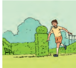
बालकः उद्याने विहरति ।