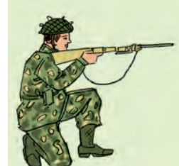
वीरः शत्रुं प्रहरति ।