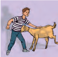
चौरः अजां हरति ।