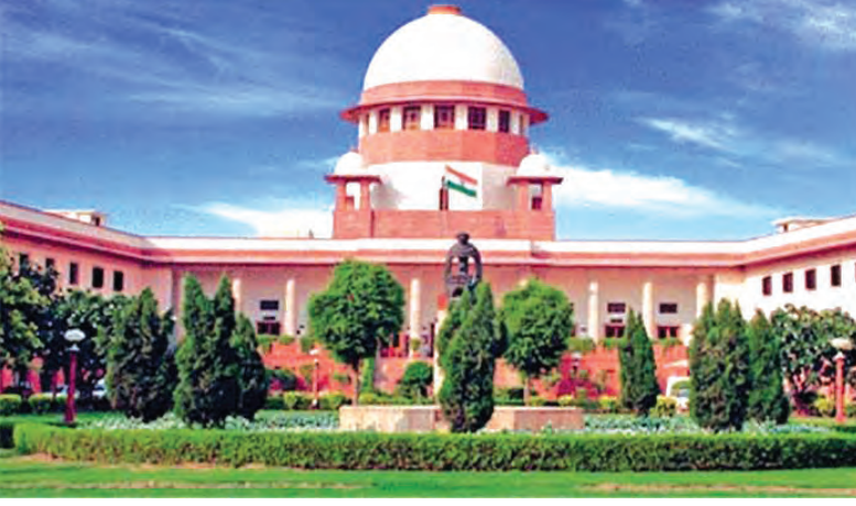
भारताचे सर्वोच्च न्यायालय-नवी दिल्ली