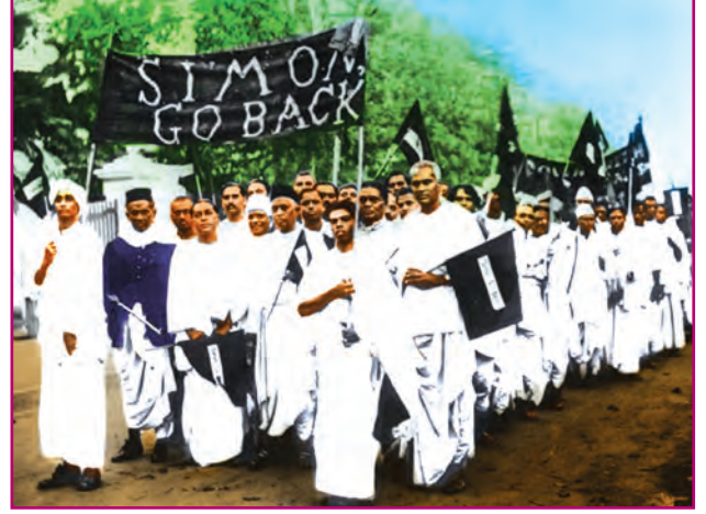
सायमन परत जा

सायमन कमिशन : १९१९ च्या मॉंटग्यू-चेम्सफर्ड कायद्याने दिलेल्या सुधारणा असमाधानकारक होत्या. त्यामुळे भारतीय जनतेत असंतोष होता. या पार्श्वभूमीवर इंग्रज सरकारने १९२७ मध्ये सर जॉन सायमन यांच्या अध्यक्षतेखाली एक कमिशन नियुक्त केले. या सात सदस्यीय कमिशनमध्ये एकही भारतीय सदस्य नव्हता, म्हणून भारतातील राजकीय पक्षांनी सायमन कमिशनवर बहिष्कार टाकण्याचा निर्णय घेतला.