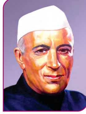
पं. जवाहरलाल नेहरू

ठरावाद्वारे राष्ट्रीय सभेने वसाहतीचे स्वराज्य या उद्दिष्टाचा त्याग केला. यापुढे भारताचे संपूर्ण स्वातंत्र्य हे राष्ट्रीय चळवळीचे ध्येय बनले.